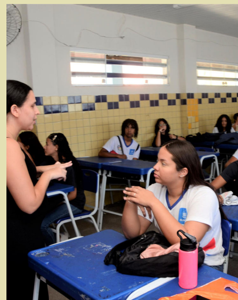
Olival Santos / Ascom Sesau

A Secretaria de Estado da Saúde (Sesau), por meio da Supervisão de Cuidados à Mulher, Criança e Adolescente (Sumca), Rede Alyne e do Programa Saúde na Escola (PSE), promoveu, ontem, uma ação educativa voltada à prevenção do vírus HIV para estudantes da rede estadual de Educação. A atividade, em alusão ao Dezembro Vermelho, foi realizada na Escola Estadual Mário Broad, em Maceió, e contou com a participação de 40 alunos do ensino fundamental, com o objetivo de ampliar o acesso dos adolescentes à informação qualificada sobre saúde sexual e reprodutiva. O Dezembro Vermelho é o mês dedicado à prevenção do HIV/AIDS e de outras Infecções Sexualmente Transmissíveis.