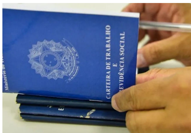
EMPREGO teve saldo positivo nos 5 grandes setores econômicos de AL

Entre os municípios, Maceió concentrou o melhor resultado em outubro,