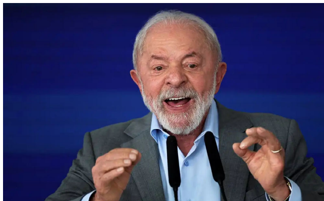
GOVERNO LULA divide a opinião dos brasileiros

Os dados da pesquisa divulgada ontem se mantiveram dentro da margem de erro com relação à pesquisa publicada em novembro,