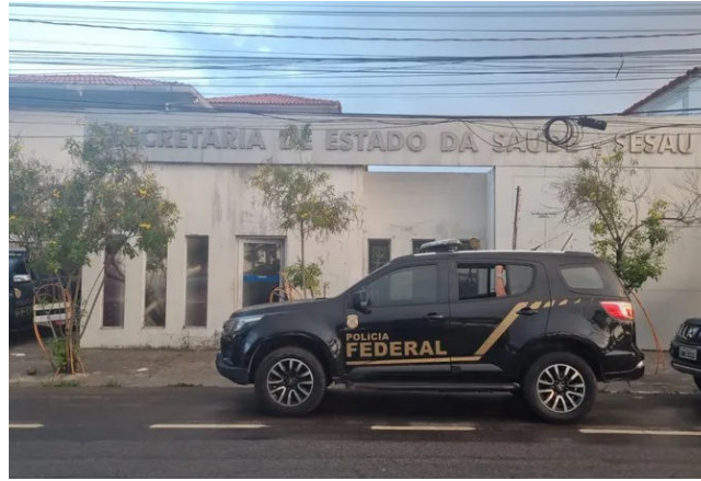
POLÍCIA FEDERAL deflagrou operação ontem em AL, PE e DF

Em nota à imprensa, o governo estadual informou que foi oficialmente comunicado sobre a operação realizada no âmbito da Sesau e que, diante dos fatos noticiados, foi acatada a imediata determinação de afasta-