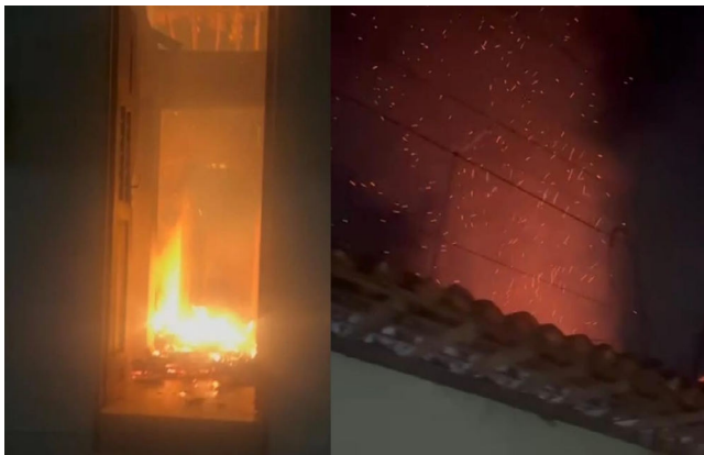
CASA onde Isabelly estava com Wagner foi consumida por chamas

O caso ocorreu na madrugada da 2ª passada. Isabelly foi socorrida pelo Serviço de Atendimento Móvel de Urgência (Samu) em estado gravíssimo, apre-