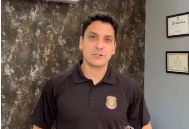
POLÍCIA FEDERAL esteve em AL, SE, MT, MG, PE e RN

Coordenada pela Delegacia de Repressão a Entorpecentes da PF, a operação cumpriu 6 mandados de busca e apreensão, 3 prisões temporárias e diversas medidas cautelares, todas