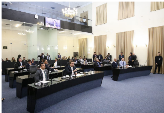
DEPUTADOS vão analisar medidas para preservar arrecadação

Outros alimentos essenciais, como arroz, café, óleo de soja, sal, macarrão e farinha de mandioca, terão a carga tributária reduzida para 7%.