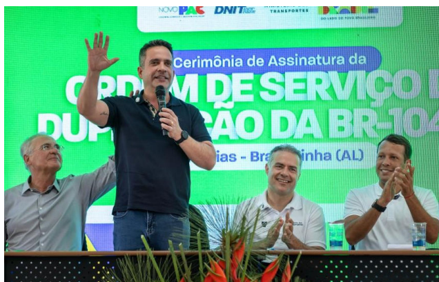
OBRAS ajudam a trazer mais segurança para a malha viária de AL

Em discurso, o governador Paulo Dantas enfatizou a relevância da parceria entre os governos estadual e federal para obras estruturantes. “Essa semana será histórica. Essa região