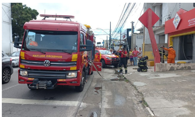
SINISTRO aconteceu na manhã de ontem em Mangabeiras

A mulher que teve queimaduras de 1º e 2º grau, nos membros inferiores e