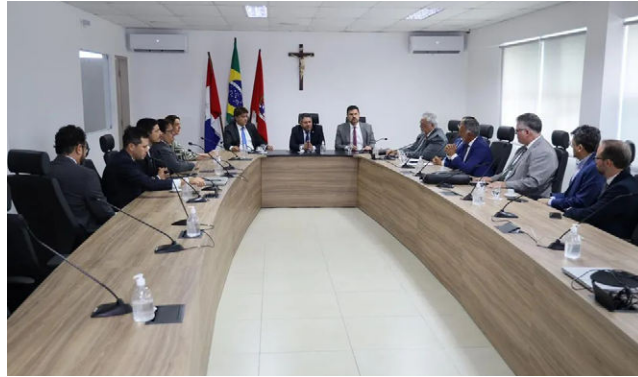
MINISTÉRIO PÚBLICO está entre os órgão que serão inspecionados

Os membros dos Conselhos devem se reunir diretamente com o governador Paulo Dantas (MDB) e com o prefeito