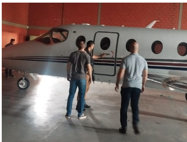
JATO EXECUTIVO Raytheon Aircraft foi apreendido

Como a aeronave ficará apreendida, o Gaesf requereu à Justiça a cessão do refe-