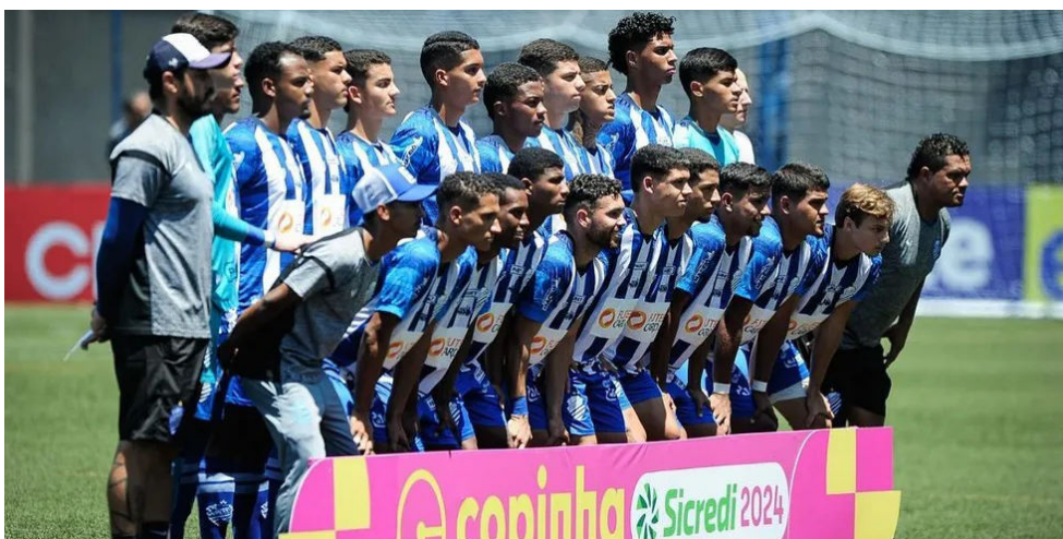
AZULÃO não conseguiu passar da fase de grupos da Copinha

Após a eliminação do time na pré-Copa do Nordeste, o CSA se prepara