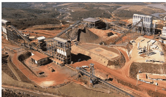
ATIVIDADE DA MINERADORA pode ser causa de danos aos imóveis