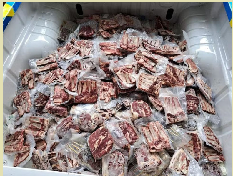
Vigilância Sanitária de Maceió

Uma operação da Vigilância Sanitária em Maceió apreendeu ontem 120 kg de carne estragada em um supermercado da Ponta Verde, em Maceió. Entre os produtos apreendidos estavam carnes bovinas, charques, linguiças e frango com o prazo de validade vencido. Além disso, os produtos estavam expostos para a comercialização de forma indevida. O estabelecimento deverá responder a processo administrativo pela infração, além de pagar multa.