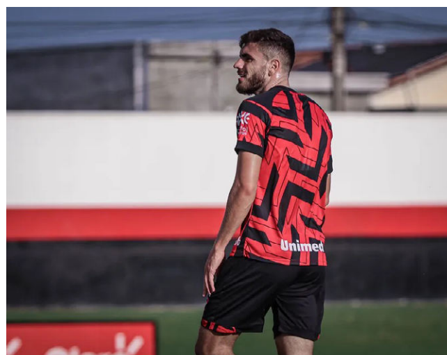
HERON chega ao Galo e deve ficar até o final da temporada 2024