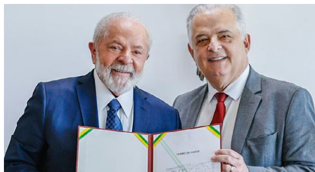
LULA E MÁRCIO FRANÇA durante assinatura da criação da nova pasta

“A pasta, agora, poderá tratar de cooperativismo e associativismo, promover cultura empreendedora inclusiva, identificação de pequenos empreendedores e profissionais autônomos, estímulo ao empreendedorismo feminino e na juventude, além de ações para desburocratização do ambiente de negó-