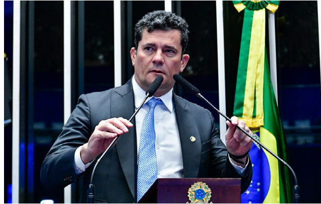
MORO estão entre os senadores que articulam mudanças no PL

No momento, senadores interessados articulam mudanças no projeto, discutidas por nomes como Sergio Moro (União-PR) e o presidente do colegiado, Sergio Petecão (PSD-AC). A previsão é que o texto seja apreciado em fevereiro, logo após o recesso parlamentar. Em seguida, se passar, a matéria também precisa