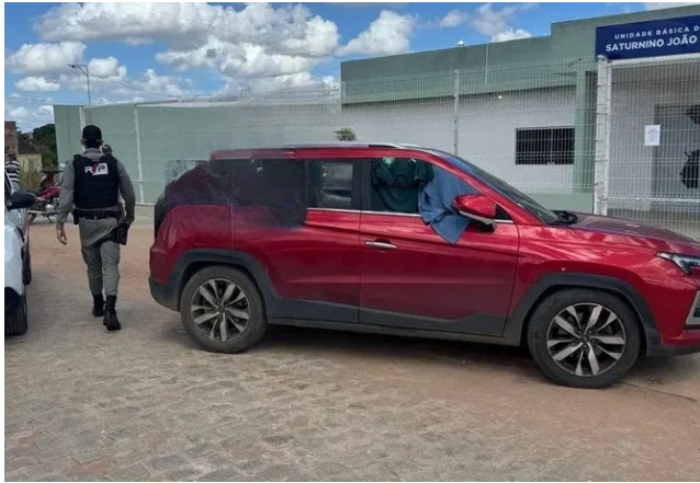
CARRO DA VÍTIMA vai passar por perícia detalhada

De acordo com a médica, há 1 ano e meio ela chegou a denunciar o ex-esposo por abuso contra a filha do casal e, desde então, estava recebendo ameaças. Ela relata que ao chegar perto de sua residência, viu o carro de