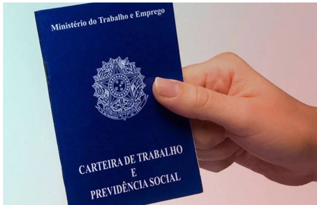
TRABALHO com carteira assinada é o sonho de muitos trabalhadores

Empresas de áreas como hotelaria, supermercados, farmácias e construção civil vão oferecer oportunidades para diferentes perfis