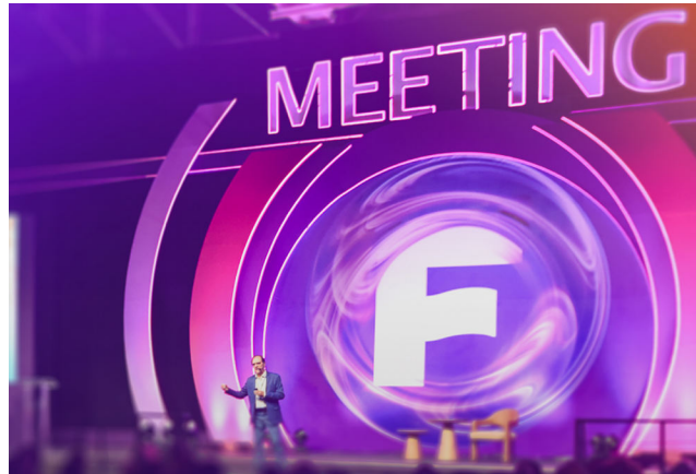
FETURIS contou com mais de 17 mil participantes nos 4 dias de evento

Os estandes dos expositores, imponentes e criativos, foram erguidos por cerca de 1.500 operários de mais de 30 montadoras. Outros cerca de 600 colaboradores temporários atuaram em áreas operacionais, como recepção, limpeza, segurança e transporte. A presença de 420 veículos de comunicação nacionais e internacionais garantiu ampla visibilidade e consolidou Gramado como epicentro das discussões sobre o futuro do turismo.