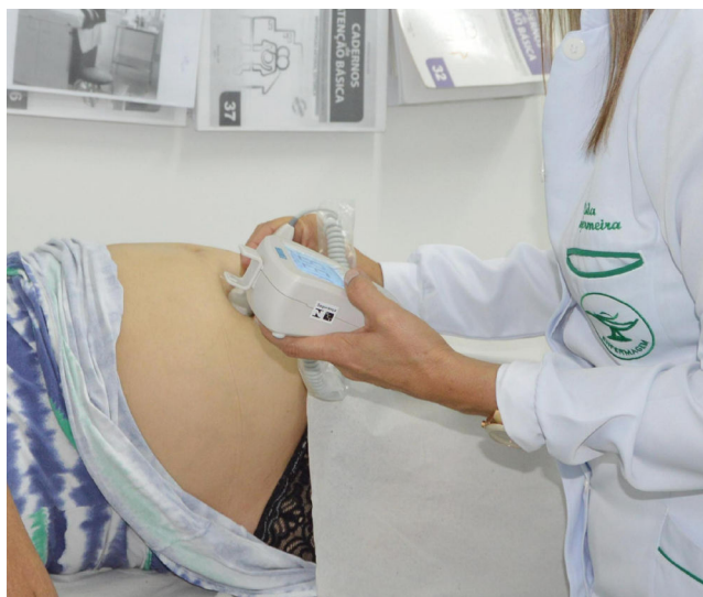
PRÉ-NATAL da gestante é fundamental para evitar parto antes do tempo

Lucas Lucena destacou que o principal cuidado que toda gestante deve tomar é assegurar as consultas e acompanhamento pré-natal. “Durante o pré-natal, são avaliados os possíveis