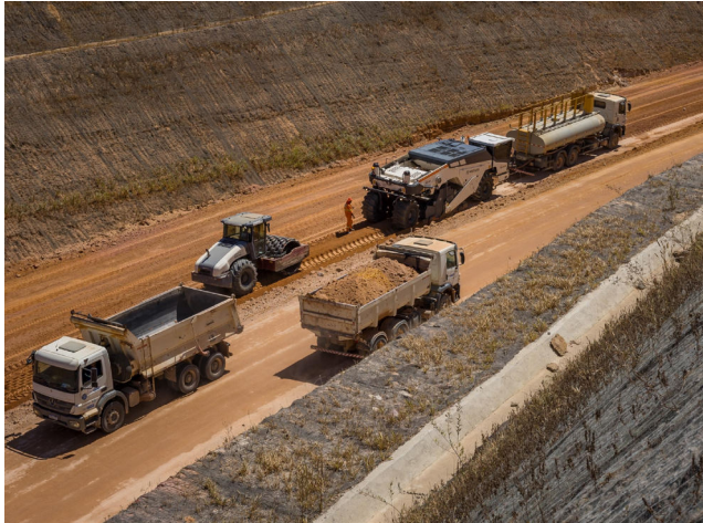
OBRAS DE INFRAESTRUTURA já estão em andamento na AL-101-Norte

Somente nessa rodovia serão criados 7.400 empre-