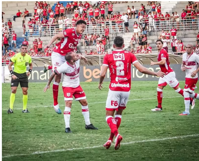
ALVIRRUBRO se despede da competição no próximo domingo