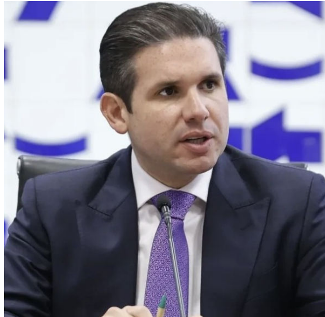
PRESIDENTE DA CÂMARA busca consenso no combate à criminalidade

Neste final de semana, o relator se debruçou sobre o texto e deve apresentá-lo a líderes partidários hoje. Ainda assim, siglas de direita devem apresentar destaques.