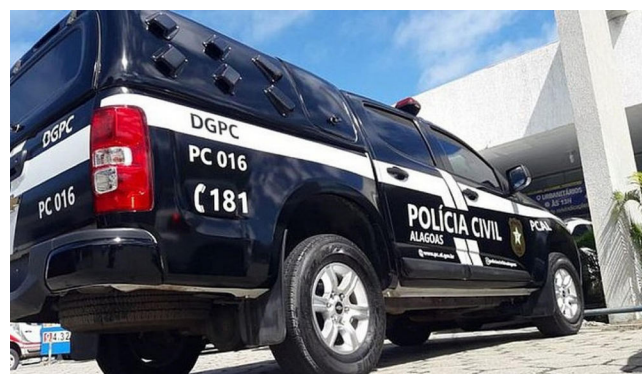
POLICIAIS CIVIS cumpriram mandado de busca e apreensão

Em Arapiraca, foi dado o cumprimento de mandado de busca e apreensão contra um suspeito investigado por envolvimento com esse esquema criminoso, existindo provas de que ele já atuou diretamente no desbloqueio de aparelhos