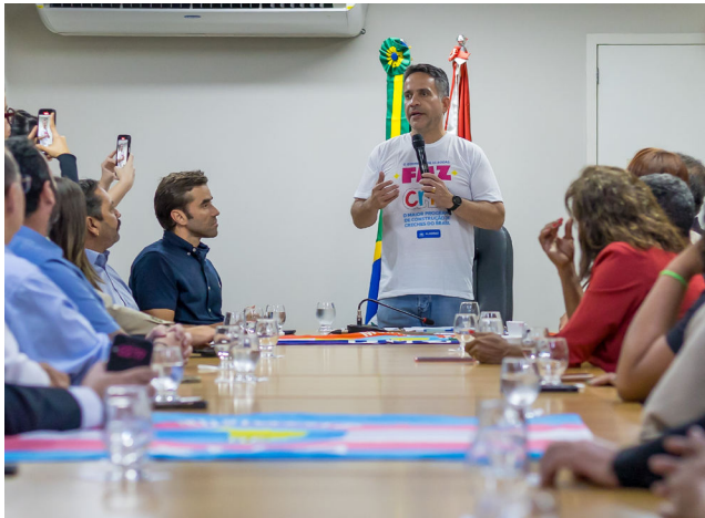
PROGRAMA foi sancionado na 3ª feira passada pelo governador

“Ao final deste ano, alcançaremos um marco