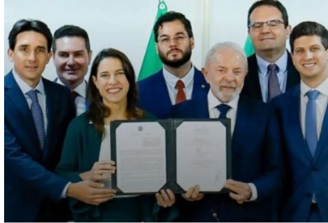
LULA, com Raquel Lyra e João Campos durante liberação de recursos

Enquanto Pernambuco comemora a conquista, Alagoas continua sem avanços concretos na construção de barragens essenciais para proteger milhares de moradores de áreas ribeirinhas afetadas por enchentes recorrentes. Críticos apontam que, apesar da bancada alagoana no Congresso Nacional dispor de emendas parlamentares individuais – cerca de R$ 17 milhões por deputado e senador – e de uma emenda de bancada estimada em R$ 400 milhões,