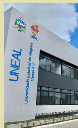
UNIVERSIDADE terá vagas para cadastro de reserva

As áreas de conhecimento, bem como as demais informações, estão dispostas no edital: https://uneal.edu.br/editais/editais-2025