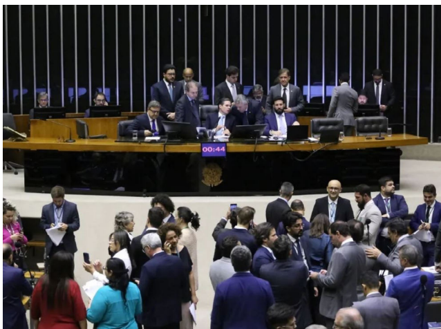
SESSÃO DA CÂMARA terminou durante a madrugada

O texto reduz incentivos ligados a contribuições como PIS/Pasep e Cofins, atendendo ao limite imposto pela Emenda Constitucional 109/2021, que prevê teto