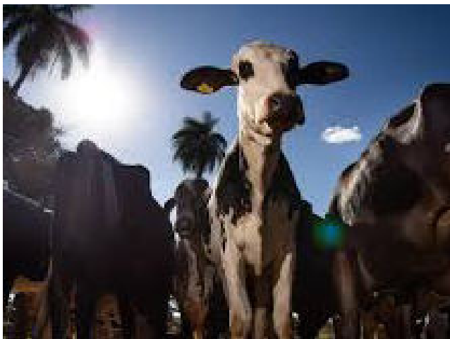
ACUSADO apresentava-se como agente federal para compra de bois

Segundo as investigações, o homem já era alvo de inquérito na Delegacia de Teotônio Vilela por crimes