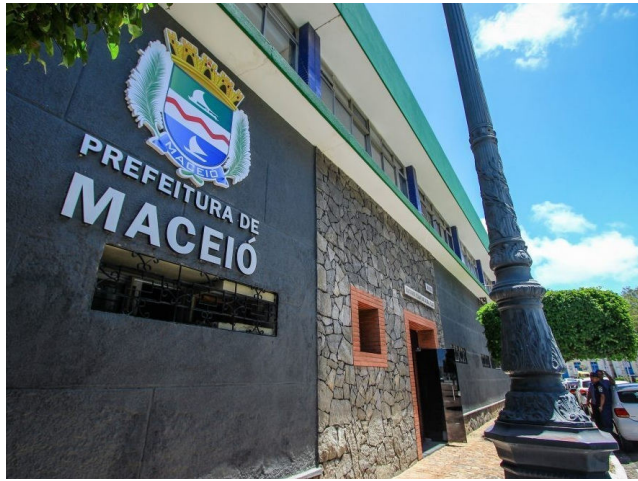
PREFEITURA oferece desconto para cota única

Segundo a Secretaria Municipal de Fazenda (Sefaz), os contribuintes que quitarem o IPTU em parcela única até 30 de janeiro de 2026 terão desconto de 20%. Para pagamentos até 27 de fevereiro, o abatimento será de 10%, enquanto quem pagar até 31 de março de 2026 contará com redução de 5%. Em todas as modalidades, as guias de pagamento devem ser emitidas exclusivamente pelo site oficial da Prefeitura, no endereço online.maceio.al.gov.br.