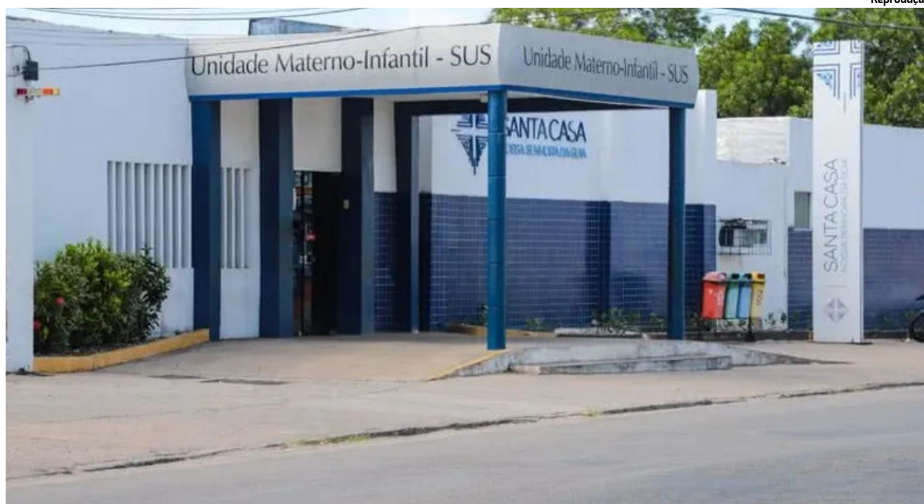
MATERNIDADE NOSSA SENHORA DA GUIA é uma das unidades da Santa Casa de Misericórdia de Maceió