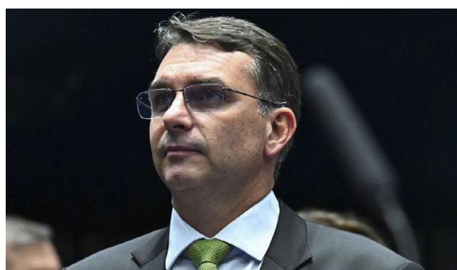
FLÁVIO teria dificuldades num potencial 2º turno contra Lula

A equipe do senador vê na alta rejeição um espaço para trabalho, avaliando que esta se deve muito mais ao pai, Jair Bolsonaro (PL), do que ao próprio Flávio. A estratégia será destacar características que diferenciam o filho de Bolsonaro, apresentando-o como alguém menos radical, mais hábil para negociações políticas e com perfil mais conciliador. Apesar do otimismo da equipe do senador, integrantes do Centrão contestam a viabilidade da candidatura, utilizando justamente a alta taxa de rejeição como argumento