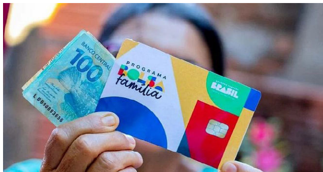
BOLSA FAMÍLIA tem valor médio do benefício em AL em R$ 687,90

O município com maior valor médio de repasse em Alagoas no mês de novembro é Inhapi, com R$ 736,46 como média do valor que chega a 3.712 famílias da