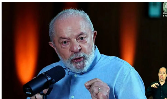
GOVERNO LULA precisará reverter tendência dos últimos anos no Brasil

A Lei de Diretrizes Orçamentária (LDO) permite que as empresas públicas tenham um déficit primário de até R$ 3 bilhões neste ano, mas a última projeção do governo é que o rombo das estatais chegue a R$ 5,6 bilhões.