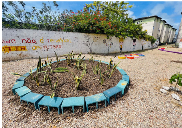
COMPOSTAGEM pode ser feita em pequena ou grande escala

O 1º passo é preparar uma composteira, que pode ser feita com tambores, cercados de arame ou de madeira e até mesmo com baldes. Outra opção é comprar composteiras prontas. Deixe-a em um ambiente bem ventilado, pois as bactérias precisam de oxigênio