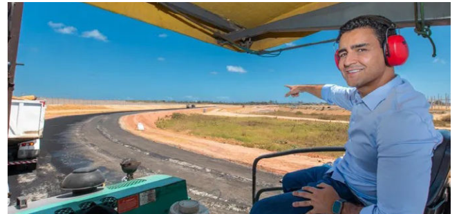
PREFEITO JHC destaca os investimentos e a boa gestão fiscal

mais de R$ 1 bilhão investidos em ações e obras estruturantes que estão trazendo desenvolvimento, qualidade de vida e dignidade para a população. Esse já é o maior programa de investimentos públicos em toda história de Maceió. E, para 2024, a meta é inves-