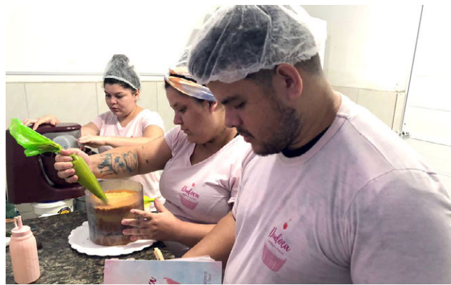
BNB tem uma linha específica destinada mulheres, o Crediamigo Delas

O gestor destaca ainda que a presença das mulheres no microcrédito é tamanha que foi desenvolvida uma