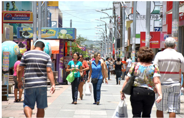
CENTRO DE MACEÍO funcionará normalmente, das 8h às 18h

amanhã, das 8h às 18h, assim como as casas lotéricas. Os shoppings também funcionam normalmente, inclusive mantendo a programação dos cinemas. No Maceió Shopping as lojas e praça de alimentação abrem às 9h e fecham às 22h. O Parque Shopping Maceió funciona das 10h às 22h e o Shopping Pátio Maceió, das 9h às 22h. Os supermercados mantêm o expediente de costume. A Federação Brasileira de Bancos (Febraban) informou que nos estados onde o Dia da Consciência Negra é feriado, como é o caso de Alagoas, o atendimento presencial estará suspenso amanhã. As repartições públicas estaduais e municipais incluindo as escolas estarão fechadas, exceto os serviços essenciais, que funcionarão normalmente. As Centrais