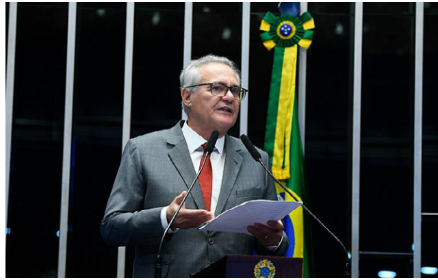
RENAN CALHEIROS quer ser presidente ou relator da Comissão

dores titulares e 7 suplentes. De acordo com o Senado, quando instalada, a Comissão contará com um orçamento de R$ 120 mil como limites de despesa, tendo o prazo de funcionamento de 120 dias. O objetivo é