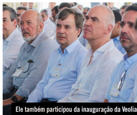
Ele também participou da inauguração da Veolia