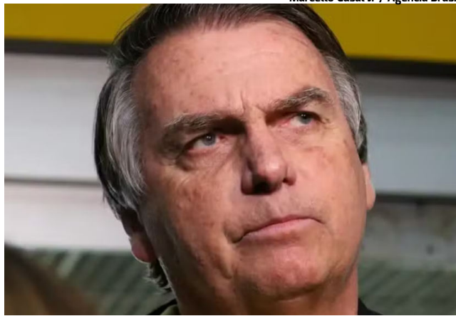
Marcello Casal Jr / Agência Brasil

A entrevista está marcada para a próxima 3ª feira, às 11h, na Superintendência da Polícia Federal, em