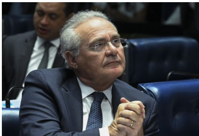
RENAN CALHEIROS fez acusações durante reunião da CCJ do Senado

Em pronunciamento, na 4ª passada, Renan Calheiros revelou conversa com o líder do governo no Senado, Randolfe Rodrigues (PT-AP). “Há pouco veio o líder do governo no Senado