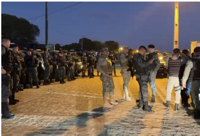
OPERAÇÃO CASMURRO cumpriu mandados expedidos pela 17ª Vara

As equipes policiais cumpriram 29 ordens judiciais emitidas pela 17ª Vara Criminal da Capital: 9 mandados de prisão preventiva e 20 de busca e apreensão. Até as últi-