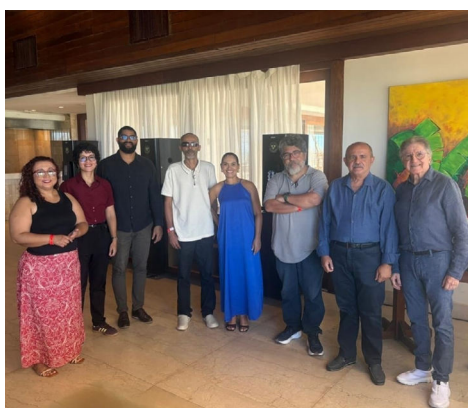
JORNALISTAS E DIRETORES dos 2 veículos participaram da confraternização; Vilar recebe cesta do sorteio

O ambiente foi marcado por muita alegria e camaradagem, reforçando os laços de equipe e a parceria entre os profissionais. “O ano de 2025 foi de grande sucesso e essa confraternização é uma forma de agradecer a dedicação e o empenho de cada um de nossos colaboradores. Estamos muito satisfeitos com