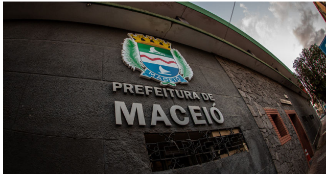
PREFEITURA DE MACEIÓ, através da Semsc, regula as atividades

As inscrições serão realizadas apenas de forma online, por meio do site: https://pre-inscricoes-reveillon.semsc.maceio.al.gov.br/ambulantes-reveillon/pages/principal .