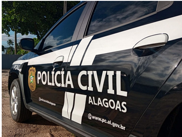
POLÍCIA CIVIL deflagrou operação após investigar crimes no Reginaldo