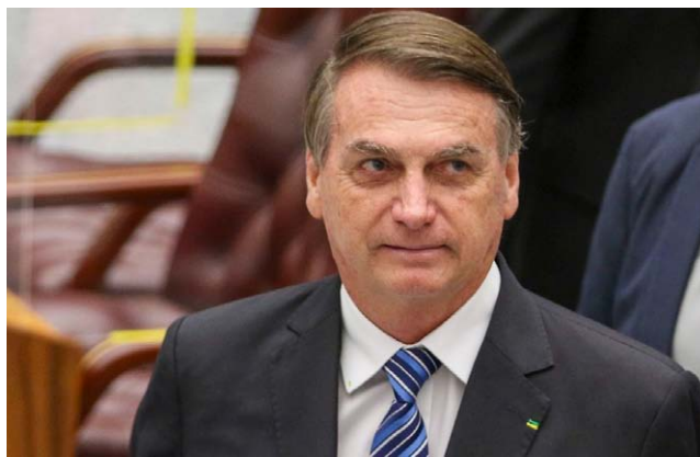
BOLSONARO: “Quem falou que eu tramei golpe? Onde está escrito?”

A ação, que corre em sigilo, apura a conduta de Bolsonaro durante reunião com embaixadores no Palá-