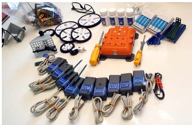
UNIÃO DOS PALMARES recebeu 460 kits de robótica para 27 escolas

Em relação à União dos Palmares, a Prefeitura Municipal recebeu R$ 7,48 milhões do governo federal – por meio de emendas parlamentares do relator – para a aquisição dos kits por meio do programa do Fundo Nacional para o Desenvolvimento da Educação (FNDE). Segundo o jornal Folha de São Paulo, o município recebeu o mais alto valor dentre das cidades alagoanas contempladas