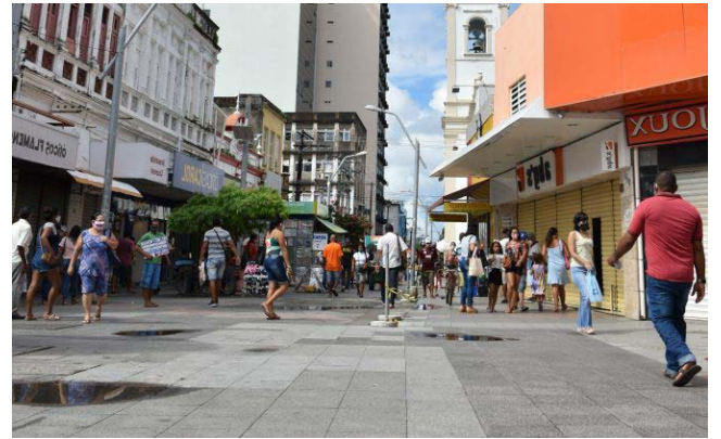
ALIANÇA COMERCIAL está animada com o incremento nas vendas

No caso da Prefeitura de Maceió, o prefeito João Henrique Caldas, o JHC (PL), antecipou para hoje o pagamento dos salários dos servidores. A medida contempla todos os funcionários efetivos, comis-