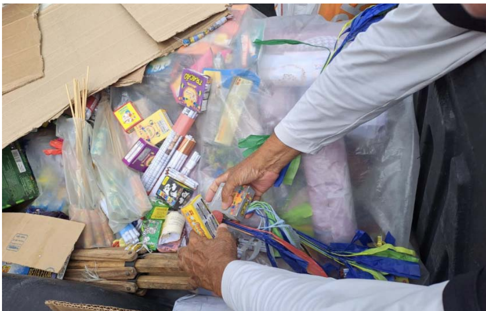
VENDEDORES de fogos não tinham os documentos essenciais para poder fazer a comercialização

Para garantir a segurança e o ordenamento na comercialização desses produtos, a Semsc realizou