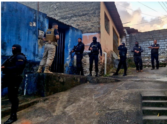
OPERAÇÃO CONTRATO CEGO cumpriu 120 mandados judiciais em AL

A operação, denominada de “Contrato Cego”, identificou – por meio das investigações – mais de 3.374 processos judiciais em todo o Brasil, sendo 120 em Alagoas. As evidências são de crimes como lavagem de dinheiro, dentre outros. Em Maceió, 2 suspeitos – um de 25 anos e outro de 34 anos – foram presos nos bairros do Benedito Bentes e Santa