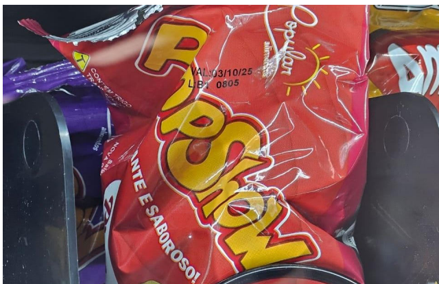
PRODUTOS fora do prazo representam risco à saúde

A máquina – que funcionava de forma automatizada, sem a presença de atendentes – estava liberando, a cada compra efetuada, produtos com prazo de validade expirado, gerando risco à saúde do consumidor.