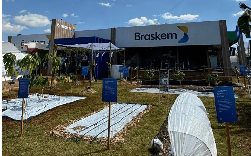
PETROQUÍMICA atuou por décadas em Alagoas extraindo sal-gema

A petroquímica destacou ainda que, sem prejuízo de novas comunicações obri-