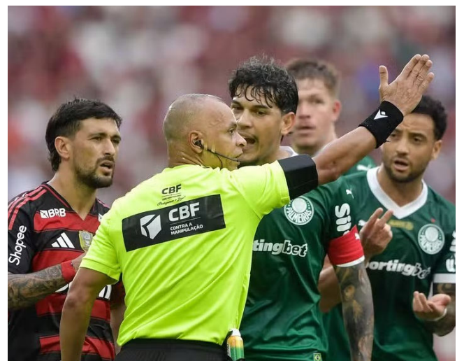
PALMEIRENSES correm o risco de suspensão por até 6 partidas