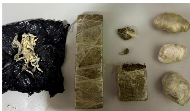
ENTORPECENTES estavam com um jovem de 21 anos

O suspeito recebeu voz de prisão e foi conduzido inicialmente ao Hospital