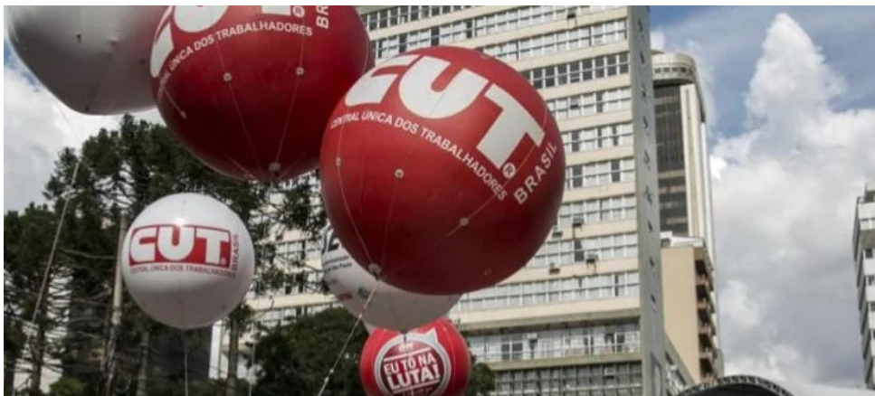
COM TANTAS ENTIDADES, capacidade de negociação é fragmentada

Em comparação, os EUA têm cerca de 300 sindicatos; Argentina, 3,5 mil; México e Canadá, 2 mil e 400, respectivamente. Entre as principais economias europeias, os números são ainda menores: Reino