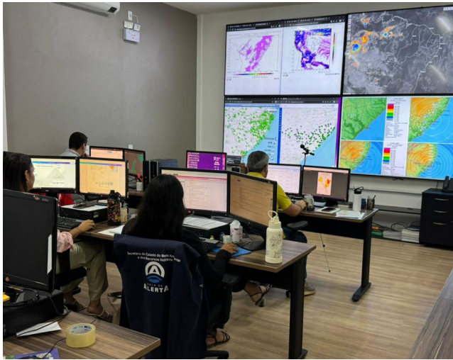
SEMARH alerta que massa de ar seco e quente pode afetar Sertão

A condição é causada pela atuação de uma massa