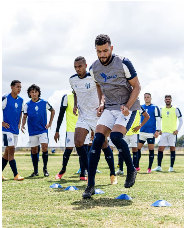
JOGADORES DO AZULÃO treinam no CT Gustavo Paiva

Sábado, pela manhã, o CSA vai fazer o 1º jogo-treino com o time sub-20, para testar os novos atletas.