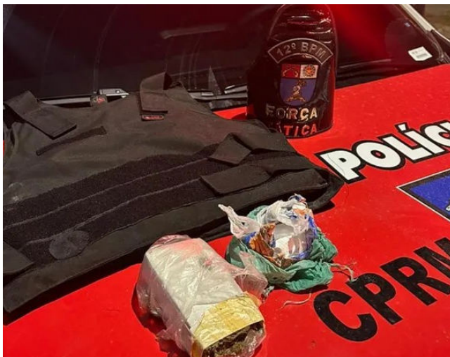
MATERIAL APREENDIDO foi levado para a Central de Flagrantes

A prisão aconteceu após denúncia anônima recebida pelo Disque-Denúncia 181 informar que o suspeito estava num terreno baldio guardando entorpecentes que seriam distribuídos na