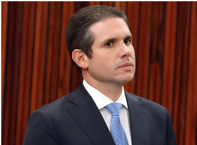
MOTTA cansou do comportamento de líder do PT na Casa

O desgaste ocorre após meses de queixas de aliados de Motta sobre a postura de Lindbergh em reuniões e debates, onde teria assumido um comportamento considerado exaltado e atuado como se fosse líder do governo, e não apenas