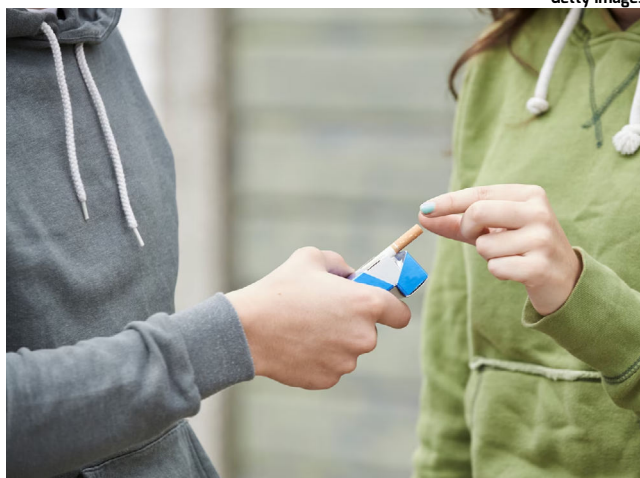
CONSUMO DE CIGARRO não tem nenhum nível seguro

O tabagismo também está associado a problemas de ritmo cardíaco, como fibrilação atrial e acidente vascular cerebral, acrescentou Maio. Reduzir o consumo de cigarros pode não ser suficiente para reverter os danos, segundo o estudo. Embora os fuman-