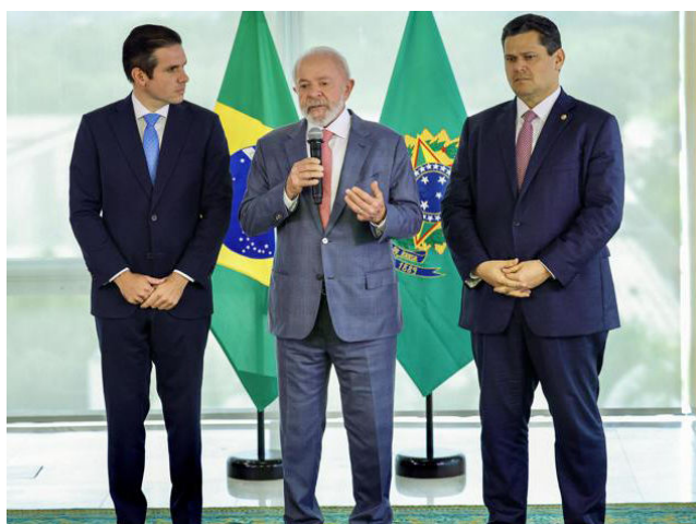
LULA busca aproximar-se novamente de Hugo Motta e Davi Alcolumbre

Depois de Lula afirmar que a proposta enfraquece o combate ao crime organizado, o deputado respondeu: “É muito grave que se