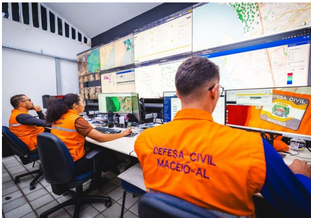
DEFESA CIVIL monitora, em tempo real, as variações no clima