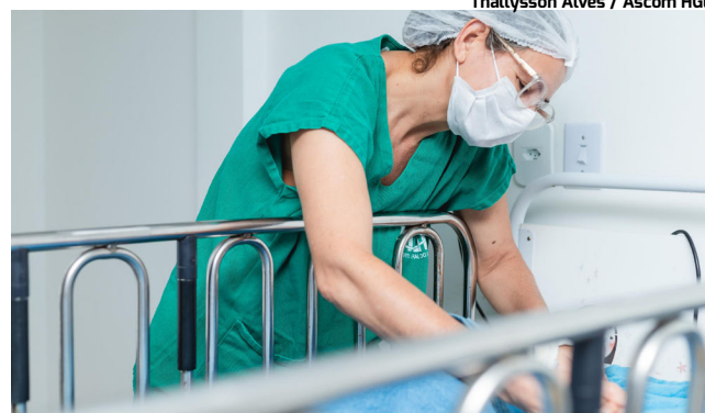
ATENDIMENTOS se multiplicaram entre dias 20 e 23 deste mês

“Enquanto uma parte da população aproveitou o feriadão, o nosso HGE seguiu funcionando com equipes completas e altamente preparadas para atender cada pessoa que chega precisando de cuidado