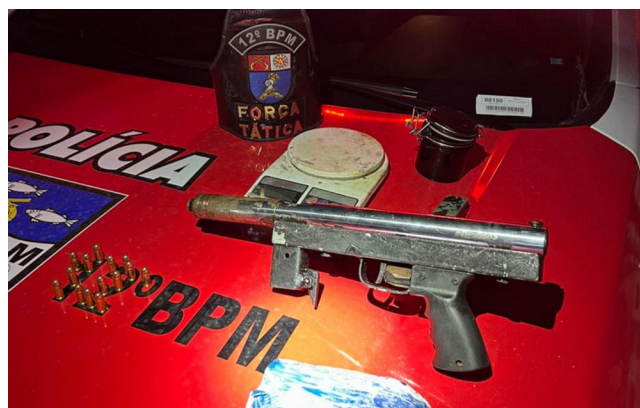
SUBMETRALHADORA foi encontrada após denúncia anônima

As guarnições da Força Tática também prenderam uma mulher de 26 anos no bairro Benedito Bentes por