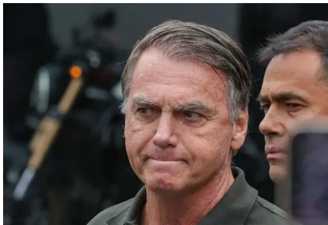
BOLSONARO está recolhido desde sábado à carceragem da PF do DF

Entre os deputados federais, Arthur Lira (PP), ex-pre-