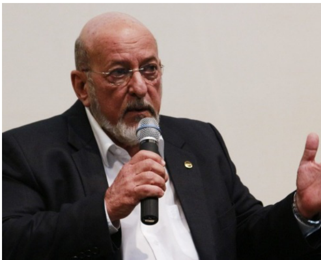
LYRA: “Seguimos empenhados em promover o desenvolvimento de AL”

“Essa proximidade com a Indústria e os demais segmentos de nossa economia é essencial”, disse a