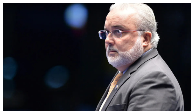
PRATES garante que não há intenção de reduzir as exigências da Lei

Prates explica que a proposta de mudança surgiu como uma demanda de alguns membros do