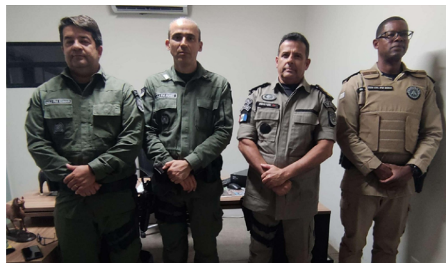
COMANDANTES reuniram-se em Delmiro Gouveia na semana passada