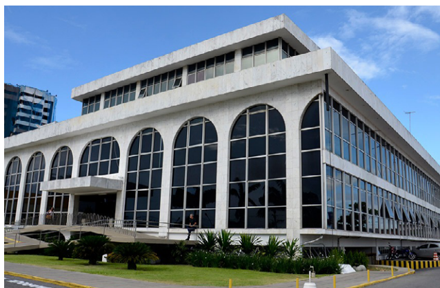
TCE já tem posição do MPC e pode arquivar ou analisar a denúncia

A posição do MPC acaba sendo uma derrota política para o senador Renan Calheiros, que tem investido nesta denúncia como forma de fortalecer o MDB na disputa pela Prefeitura de Maceió, no próximo ano. Ele ingressou com outra ação na Justiça, que visa suspender a compra e também pede ao Ministério Público Estadual que investigue o caso.