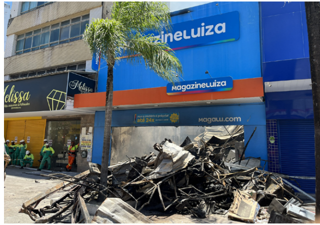
LOJA DE MÓVEIS E ELETRODOMÉSTICOS foi consumida pelas chamas