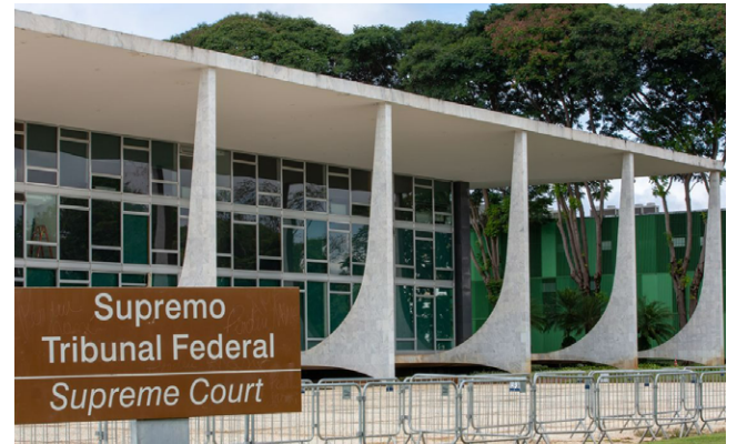
SUPREMO busca uma solução mais rápida para o impasse

Com isso, os R$ 2 bilhões do valor da outorga deixam de se concentrar institucionalmente