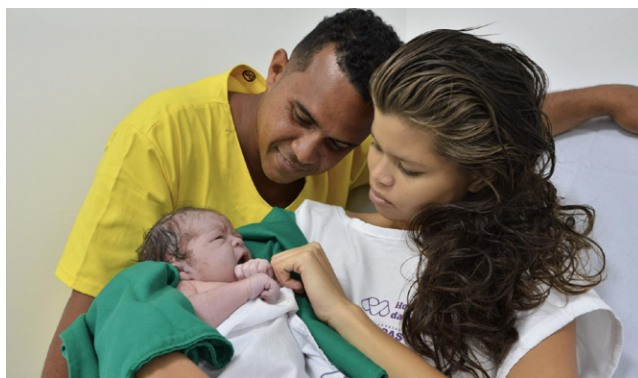
REDE CEGONHA assiste mães, recém-nascidos e crianças até 2 anos

O VII Encontro do Fórum Perinatal de 2023 irá promover um espaço de conhecimento e diálogo, colaborando com a criação do conhecimento coletivo e com a educação em saúde. Ainda durante o evento