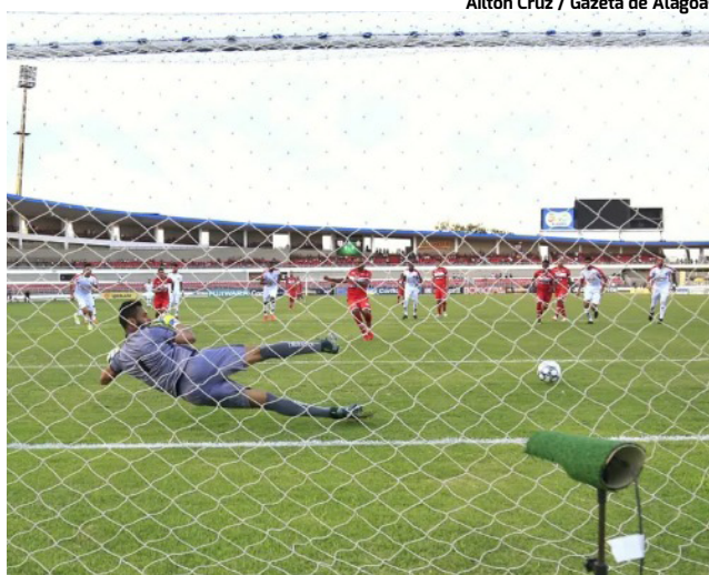
GALO DERROTOU o Boa Esperança pela 34ª rodada da Série B em 2018

No Brasileiro de 2020, os últimos cinco jogos do CRB foram contra o Guarani, Operário-PR, Figueirense, Ponte Preta e Cuiabá, conquistando nove pontos dos 15 disputados. Ficou, no geral, em 10º lugar, com 52 pontos.