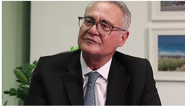
RENAN CALHEIROS é o autor do pedido da CPI da Braskem

Os danos ambientais, que são alvo da investigação, afetaram 60 mil pessoas de forma direta, mas 200 mil de maneira total, estima-se. Portanto, além de investigar os danos ambientais, Renan Calheiros poderá direcionar a CPI – e conforme bastidores, deve fazê-lo – para também tratar de problemas na Região Metropolitana de Alagoas, além também de querer buscar detalhes sobre o acordo de indenização firmado entre a Braskem e o município de Maceió.