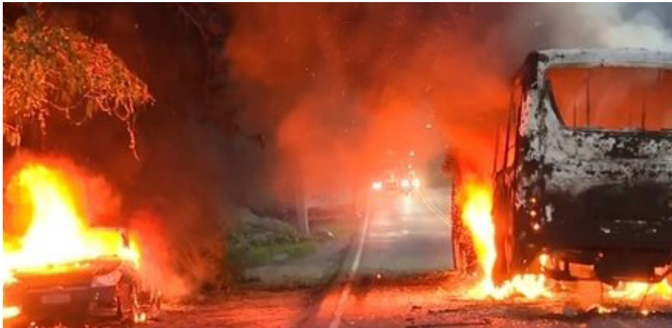
ONDA DE VIOLÊNCIA assustou os cariocas na volta para casa e causou diversos transtornos

Ataques a ônibus, trem em chamas e suspensão