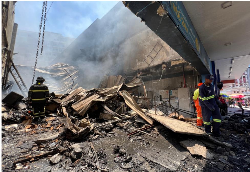
INCÊNDIO aconteceu no começo da manhã e causou alvoroço no Centro da capital

APÓS INCIDENTE, Defesa Civil realiza inspeção e prédio do Magazine Luíza pode ser demolido