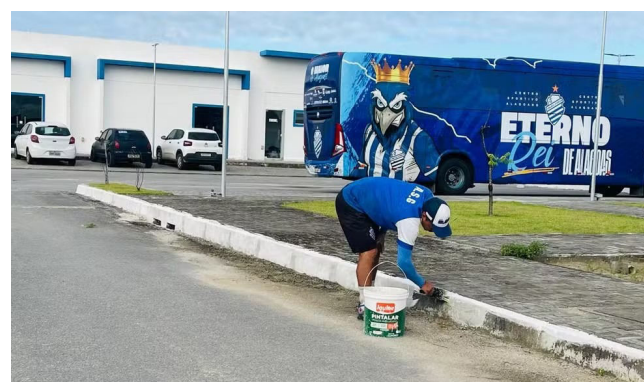
CT GUSTAVO PAIVA vai ganhar estrutura para hospedar os atletas