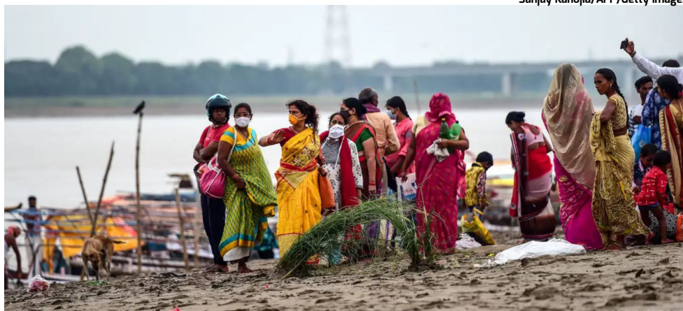
FESTIVAL RELIGIOSO HINDU acabou em tragédia nesta semana no Leste da Índia

Nele, as mulheres jejuam por 24 horas e oferecem orações para o bem-estar de seus filhos. Elas também viajam para rios e lagoas em sua vizinhança para tomar banho, às vezes acompanhadas de seus filhos.