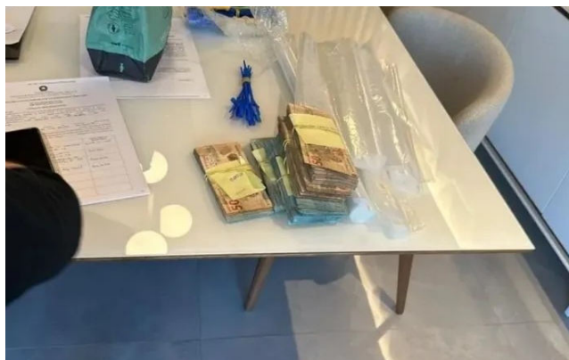
MERCADO DE DADOS cumpriu mandados de prisão, busca e apreensão

Além dos invasores, a organização ainda contava com o auxílio de servidores que comercializavam suas credenciais e até mesmo o uso do certificado digital deles. Além dos 3 funcionários já citados, a operação também apontou o envolvimento de um estagiário no crime.