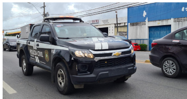
POLÍCIA CIVIL segue procurando por mais vítimas

investigações para identificar quantas vítimas podem