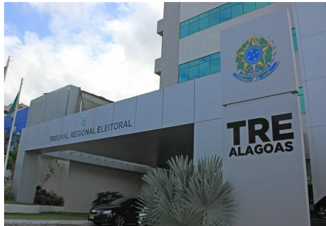
TRE tem papel fundamental de aprovar ou não as candidaturas

Além dele, outros candidatos a prefeito também