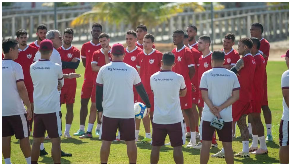
GALO precisa voltar a vencer para permanecer na Série B do Brasileiro

O CRB tem pela frente 10 jogos para continuar