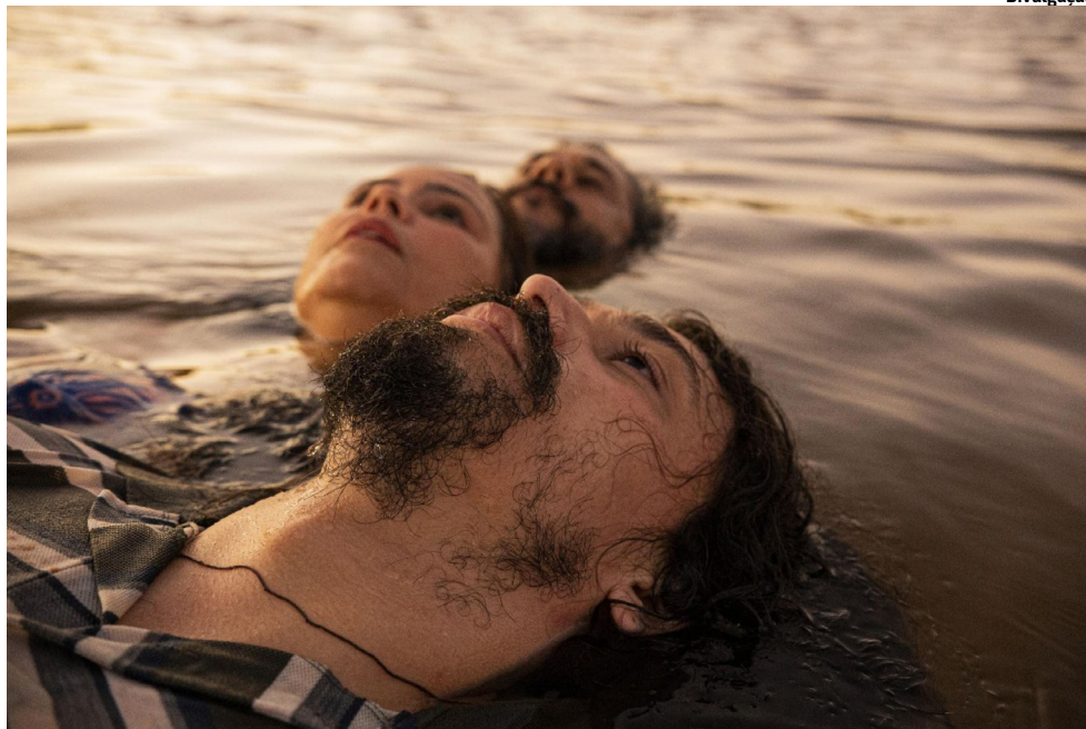
DOIS CABRAS foi gravado em cenários autênticos de Alagoas

“Vivemos tempos em que a intolerância voltou a crescer, e falar sobre homofobia e os preconcei-