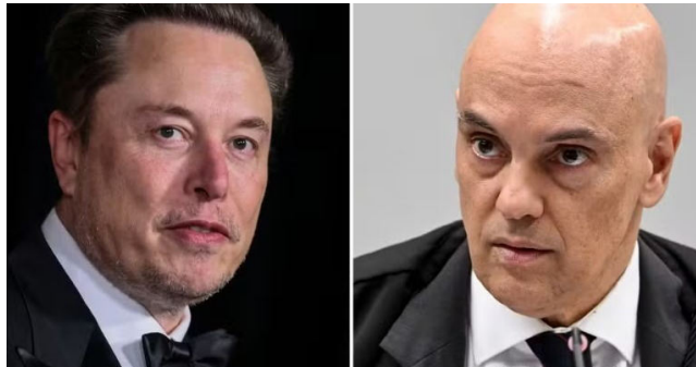
ELON MUSK descumpriu ordens de Moraes e acabou voltando atrás

O pedido para que a rede social volte a operar no país é assinado por advogados de 3 escritórios: Fabiano Robalinho Cavalcanti e Caetano Berenguer