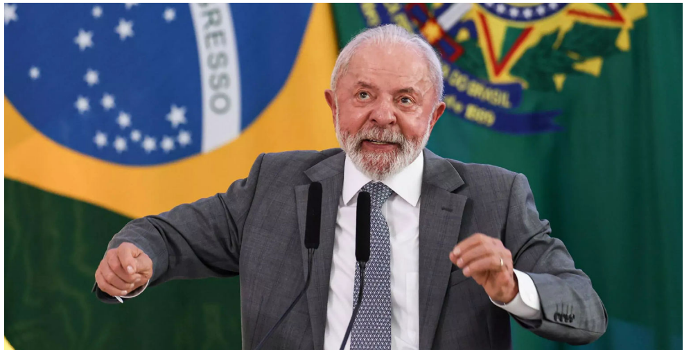
LULA: “A gente não pode continuar a mesma jornada de trabalho de 1943”

“São coisas que a sociedade moderna do século XXI exige. A gente não pode continuar com a mesma jornada de trabalho de 1943. Não é possível. Os métodos são outros. A inteligência foi aprimorada. Essa revolução digital mudou a lógica, inclusive, da produção”, declarou o presidente.