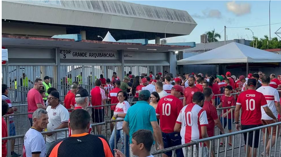
PÚBLICO tem sido um importante aliado do clube nas competições em casa

Nesta edição da competição, para se ter ideia, o clube que mais lucrou com ingressos foi o Remo, que chegou à Série A com uma arrecadação de R$