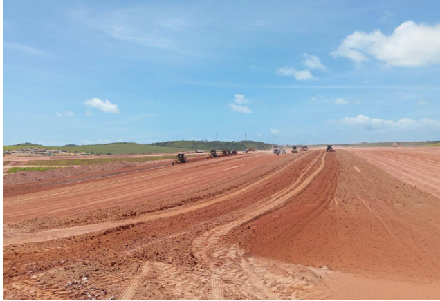
ENTRE OBRAS estruturantes está construção do Aeroporto de Maragogi

Entre as entregas programadas para o período estão 2 trechos da AL-220: o segmento de 26 km entre Batalha e Olho d'Água das Flores, e o de 40 km de Olho d'Água das Flores até o Distrito Piau, em Piranhas. A duplicação