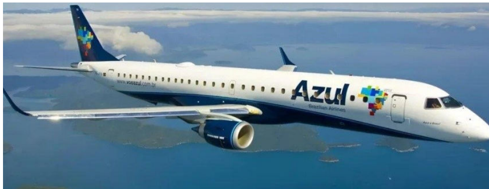
AZUL anunciou nova rota sazonal fortalecendo a malha aérea que atende o Aeroporto Zumbi dos Palmares

Serão voos diretos em datas específicas, concentrados nos períodos de férias e feriados prolongados, ampliando as opções de chegada à capital e fortalecendo a malha aérea que atende o Aeroporto Zumbi dos Palmares. A iniciativa dialoga com o movimento de crescimento que Maceió vem registrando nos últimos anos, impulsionado por investimentos em infraestrutura, promoção turística permanente e parcerias consolidadas com o trade nacional.