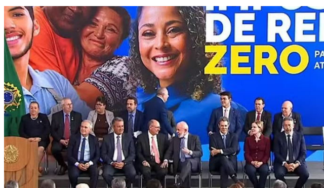
EVENTO reuniu Lula, ministros e parlamentares no Palácio do Planalto

A a ministra das Relações Institucionais, Gleisi Hoffmann, minimizou as ausências e destacou a importância de ambos na aprovação da proposta. O ministro da Fazenda, Fernando Haddad, reforçou a participação dos presidentes das Casas e afirmou que eles foram “diligentes” para