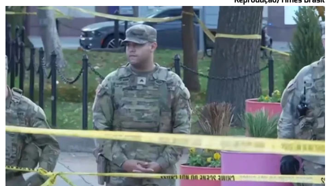
APÓS TIROTEIO, Guarda Nacional reforçou segurança na Casa Branca

O governador da Virgínia Ocidental, Patrick Morrisey, afirmou que está recebendo informações conflitantes sobre o estado de saúde dos 2 membros da