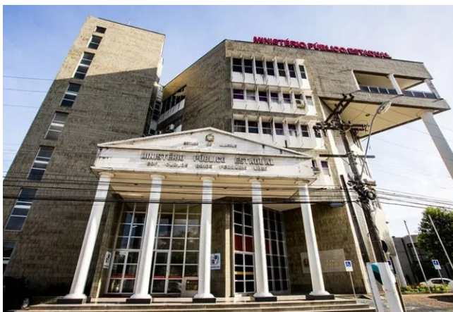
MINISTÉRIO PÚBLICO defende simetria entre carreiras essenciais à Justiça

De autoria do próprio Ministério Público, o PLC permite que promotores e procuradores que acumulem atribuições funcionais