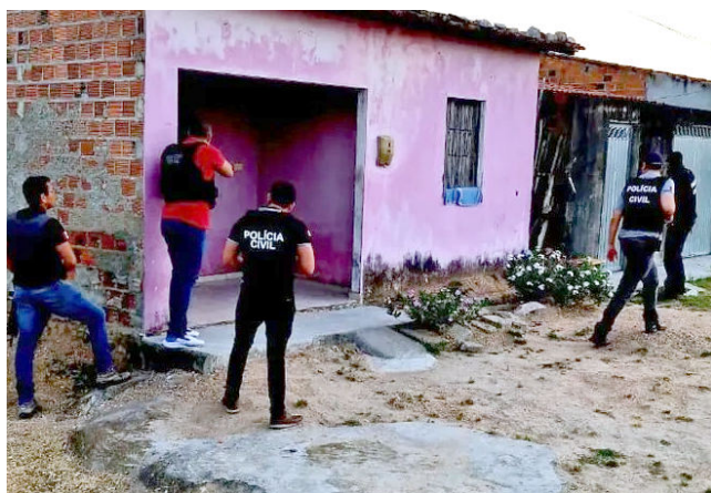
4 SUSPEITOS foram presos ontem pela Polícia Civil