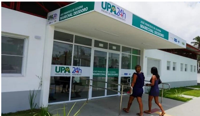
HOMEM estava internado na UPA José Francisco de Oliveira

A Prefeitura de Marechal Deodoro, por meio de nota