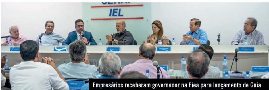
Empresários receberam governador na Fiea para lançamento de Guia

Já o Núcleo de Práticas Jurídicas (NPJ) vai receber casos relacionados aos direitos dos consumidores, por meio do convênio com o Procon Maceió, bem como demandas de conciliação para o Centro de Solução de Conflitos e Cidadania (Cejusc), como divórcio consensual, guarda de menores, pensão, cobrança, problemas em condomínio etc.