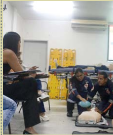
Arnaldo Santos / Ascom Samu

SAMU CAPACITA PROFISSIONAIS DE UNIÃO DOS PALMARES