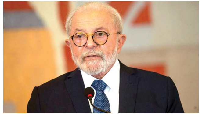
LULA reiterou a disposição do Brasil em colaborar com fim da guerra

O presidente da Ucrânia, Volodymyr Zelensky, também esteve no Japão e participou de uma das sessões de debates do G7 sobre paz e prosperi-