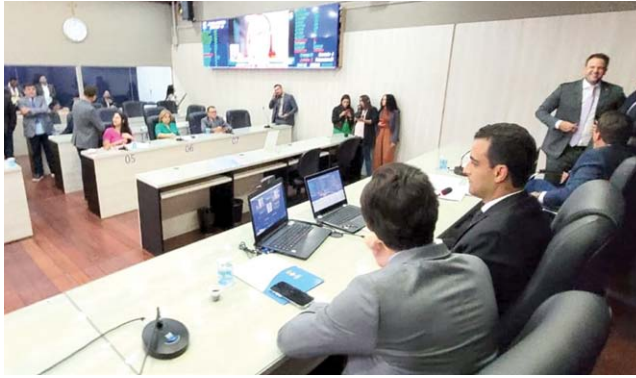
CÂMARA DE MACEIÓ é considerada estratégica para as eleições de 2024

Conforme bastidores, Renan esperava lançar – na semana passada – uma frente de oposição com pelo menos 10 vereadores por Maceió, já com foco nas eleições vindouras, quando o MDB terá candidato ao Executivo municipal para enfrentar o atual prefeito João Henrique Caldas, o JHC (PL). Porém, a expectativa não se concretizou. JHC conseguiu – na disputa