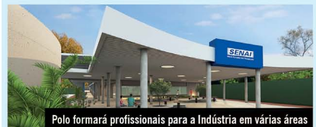
Polo formará profissionais para a Indústria em várias áreas

São quatro salas de aula, três laboratórios de informática, uma sala de desenho, quatro oficinas e, em parceria com a Secretaria de Estado da Ciência, Tecnologia e Inovação (Secti), o Polo Multissetorial do Senai contará com um Oxetech Lab.