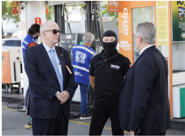
OPERAÇÃO VERUS foi deflagrada ontem em Maceió

Além disso, há também suspeitas do uso de maquinetas de cartões que podem ter sido registradas em nome