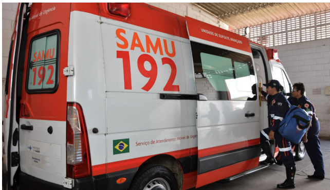
SAMU está de prontidão para atender casos de envenenamento