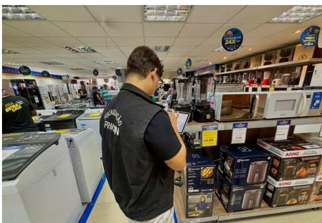
FISCAIS DO PROCON MACEIÓ percorreram lojas conferindo preços

É importante ainda desconfiar de descontos muito altos, analisar avaliações de outros consumidores e conferir as políticas