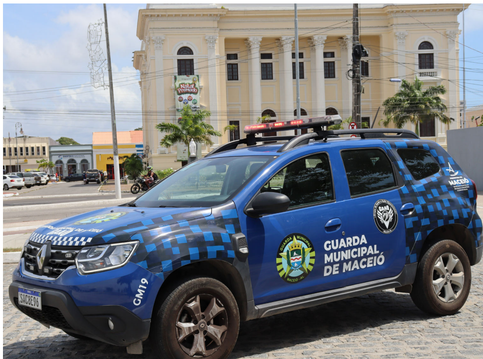
GUARDA MUNICIPAL não tem concurso para novos agentes desde 2000

A seleção oferecerá 50 vagas para o cargo de Guarda Municipal, com exigência de ensino médio completo e Carteira Nacional de Habilitação (CNH) – esta última poderá ser