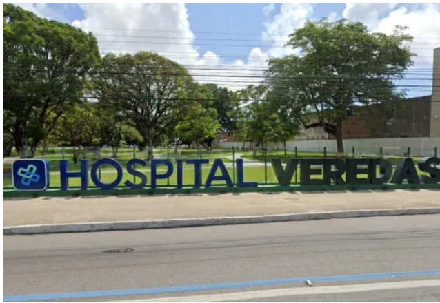
VEREDAS está sob intervenção judicial, mas problemática persiste

Mesmo com a medida, os problemas se agravaram: os trabalhadores da saúde completam 15 dias de greve em protesto contra quatro meses de atraso nos salários e o não pagamento do complemento do piso nacional da enfermagem. Em ato pacífico, eles seguem