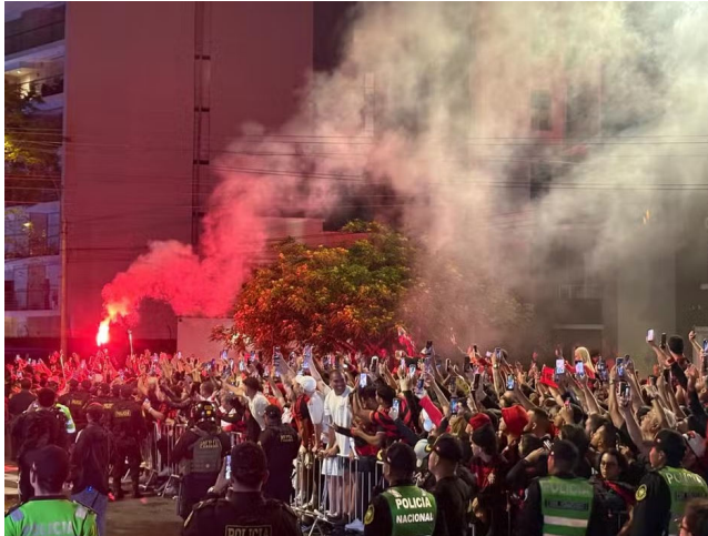
TORCEDORES foram até o hotel, que ficou colorido de vermelho e preto

O elenco do Flamengo pousou em Lima por volta das 22h e chegou ao hotel onde ficou hospedado cerca de 1 hora depois. Desde a tarde da 4ª feira, torcedores se reuniram no bairro de Miraflores em concentração para a recepção aos