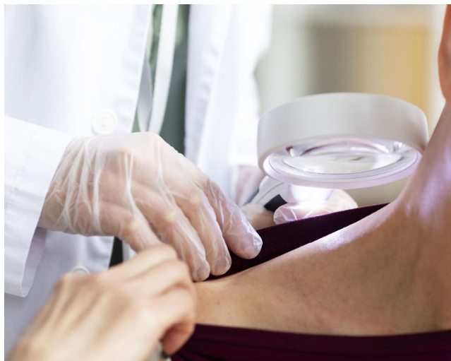
CÂNCER DE PELE está entre os carcinomas de grande incidência

Segundo a diretora, o câncer é uma doença global, mas a doença não é distribuída de forma igual em todas as regiões do mundo, com disparidades geográficas muito marcadas em incidên-