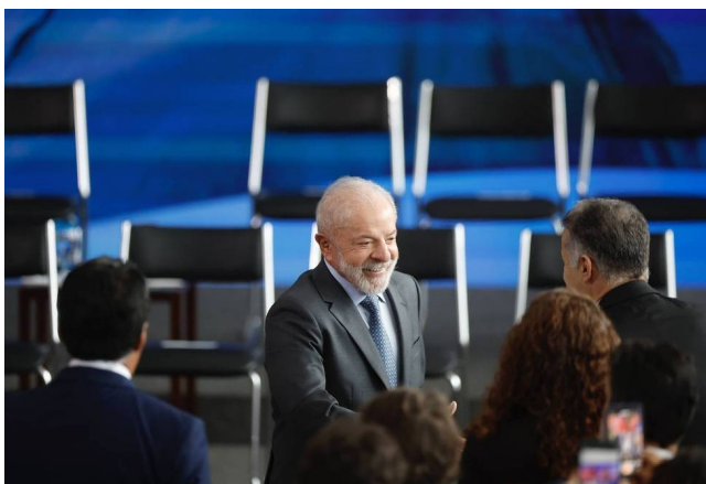
LULA enfrenta mais uma vez rusgas com o Legislativo

A rusga coloca em risco temas centrais para o Planalto, como o Orçamento de 2026, a PEC da Segurança Pública e a aprovação de Jorge Messias para o STF, que podem virar derrotas expressivas para o presidente Lula (PT).