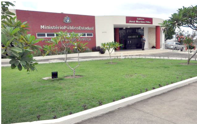
MP ouviu denunciantes que tiveram prejuízo financeiro e psicológico

De acordo com o órgão ministerial, se comprovada a conduta, ela pode se encaixar no artigo 171 do Código Penal, como estelionato. A