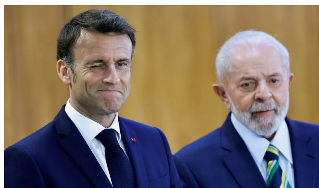
MACRON E LULA já mostraram que concordam em diversos assuntos

Ele argumentou que a China vive um momento de