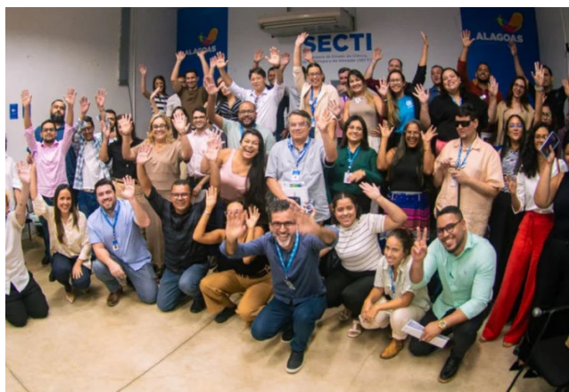
INICIATIVA faz parte do programa Visão Alagoas 2030

As Diretrizes para uma Estratégia Estadual de Cidades Inteligentes