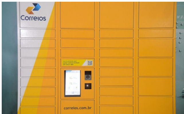
MESMO COM CRISE, governo não cogita privatizar os Correios

O levantamento não inclui Petrobras, Eletrobras e bancos públicos, e considera apenas a variação da dívida. Entram no cálculo empresas como Correios, Casa da Moeda, Infraero, Serpro,