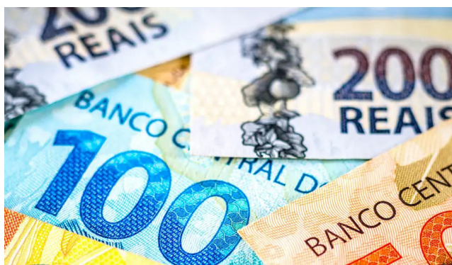
DESONERAÇÃO do IR deve beneficiar até 26,6 milhões de brasileiros

Uma das principais bandeiras de campanha de Lula em 2022, a medida começa a valer a partir de janeiro. Em discurso, Lula destacou que não existe “sociedade igualitária”, mas que é preciso governar para aqueles que precisam do Estado. “A economia não cresce por conta do tamanho da conta bancária de ninguém, a economia cresce por conta do consumo que a sociedade pode ter a partir dos alimentos”, disse.