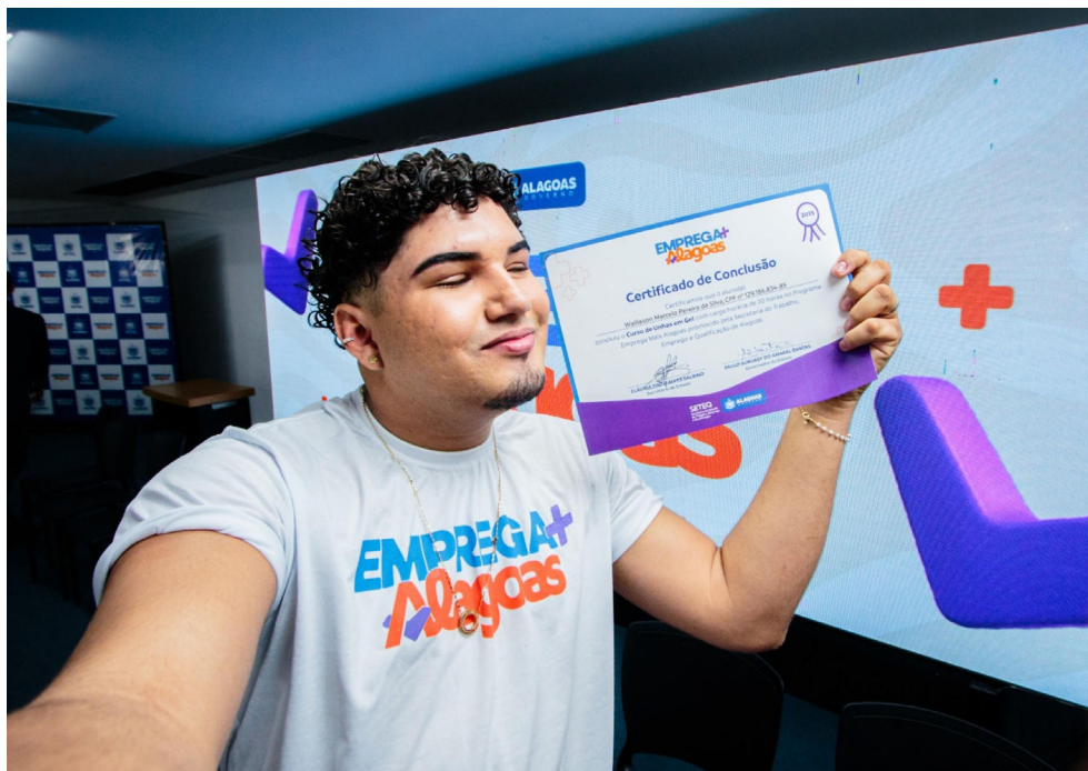
INICIATIVAS como o Emprega + Alagoas são importantes para a empregabilidade dos alagoanos

No acumulado de janeiro a outubro, Alagoas registrou 16.347 vagas formais, alta de 3,51% ante o mesmo período de 2024. O estoque total de empregos no setor privado é de 482.590