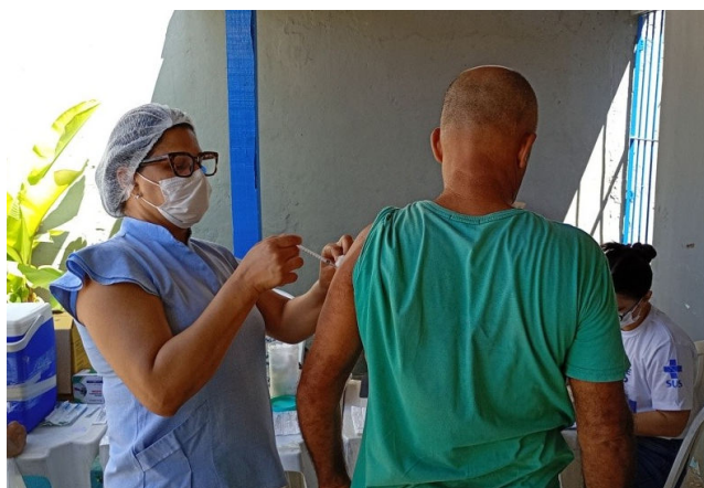
IMUNIZAÇÃO fez parte das ações realizadas pela SMS