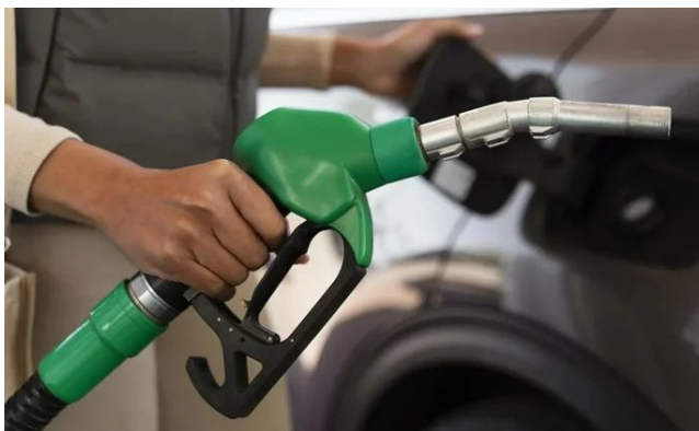
ETANOL é mais caro em AL do que em outros estados produtores

Como se trata de números do Confaz, isso significa dizer que é sobre este valor que a Secretaria Estadual da