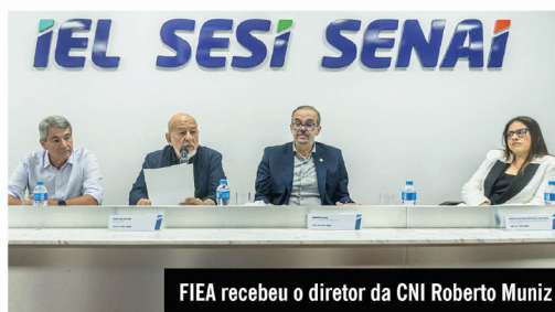
FIEA recebeu o diretor da CNI Roberto Muniz

galgos que afetam a infraestrutura brasileira, citando o baixo volume de investimentos, a lentidão nas obras públicas e a insuficiência de modais logísticos modernos. Segundo ele, a ineficiência geral da economia gera um impacto anual estimado de R$ 1,7 trilhão, equivalente a 20% do PIB. "É impossível falar em competitividade sem enfrentar com urgência o déficit de infraestrutura, especialmente no Nordeste, onde 74% dos empresários avaliam as condições como regulares, ruins ou péssimas", observou.