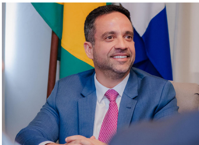
DANTAS afirma que permanece no governo até o fim do mandato

Caso dê um passo no sentido de uma candidatura, abre espaço para que o vice-governador Ronaldo Lessa (PDT) assuma o governo estadual, o que pode trazer novidades para o jogo de montagem de chapa. Com Lessa no comando, o governo é outro. Alguns aliados de Dantas - segundo apurou o Correio Alagoano - defendem que o chefe do Executivo estadual deixe o cargo em abril próximo e se candidate, colocando seu nome à disposição para um