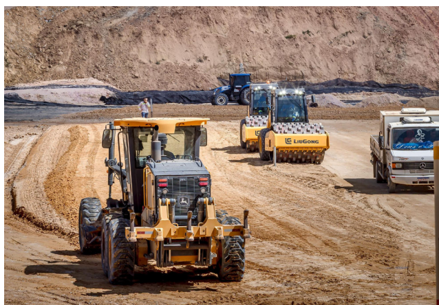
OBRA de responsabilidade da Setrand está a todo vapor

A nova estrada, além de atender aos pedidos da população local, reduziu os custos com desapropriação de imóveis e preservou os prédios históricos encontrados pelo caminho traçado no