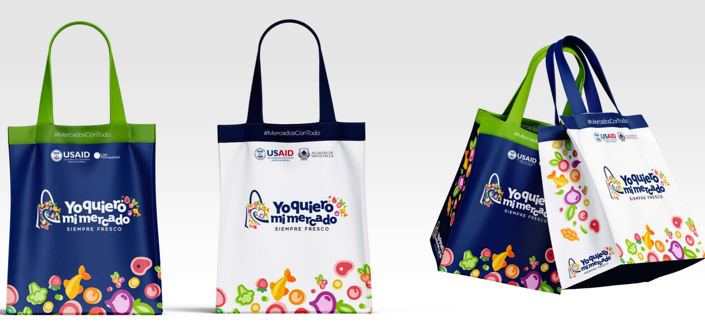
Imagen de carácter ilustrativo, acabado puede variar según proveedor