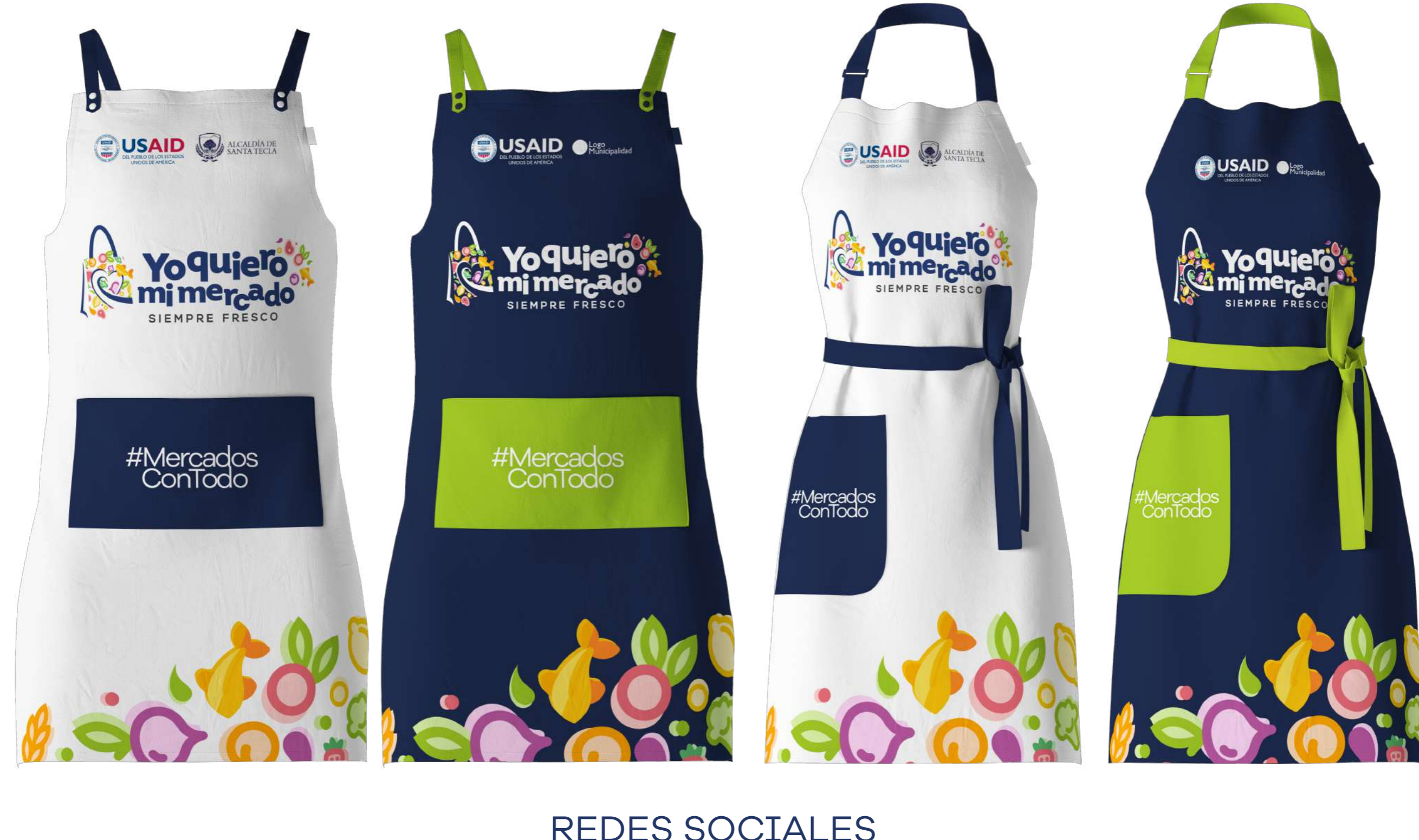
Imagen de carácter ilustrativo, acabado puede variar según proveedor