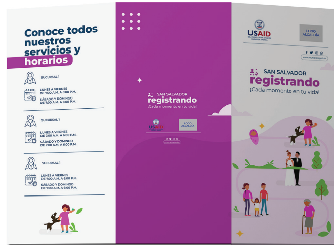
Brochure / Triptico