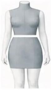
Torso + Short Skirt