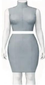
Torso + Above-Knee Skirt