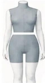
Torso + Short Legs