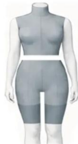
Torso + Above-Knee Legs