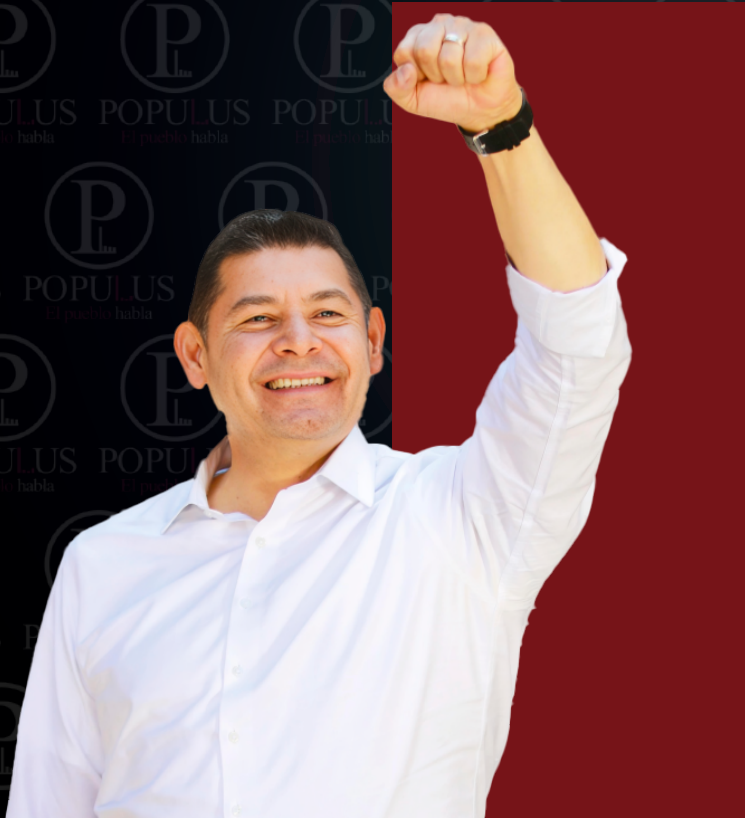
Alejandro Armenta Mier