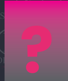
AÚN NO DECIDE