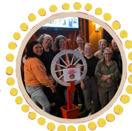
Tous les parents du CPE La Giroflée des Bergeronnes