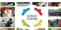
Services aux citoyens