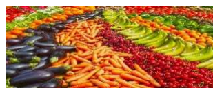
Agro-alimentaire / forestier