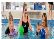
Loisirs / Sports / Activités