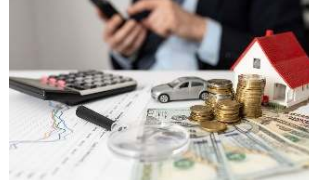
Économie / Entrepreneuriat