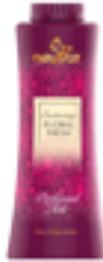
FLORAL FRESH TALC