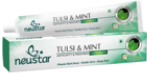
TULSI & MINT TOOTHPASTE