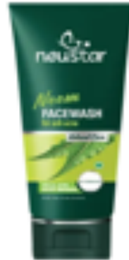
NEEM FACE WASH