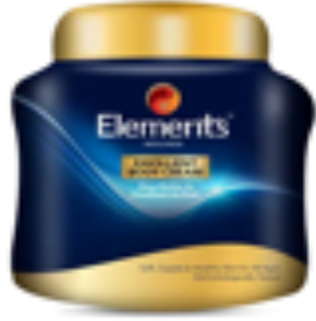
EMOLLIENT BODY CREAM