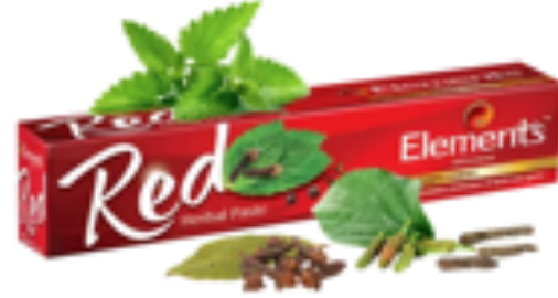
RED HERBAL TOOTHPASTE