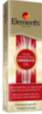
UNDER EYE GEL