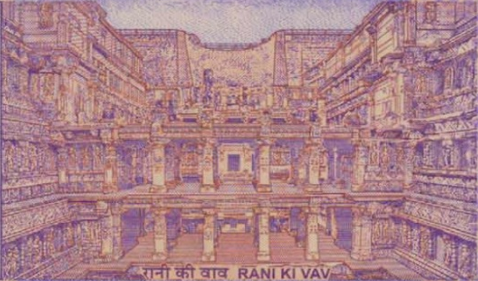
रानी की वाव RANI KI VAV

एक टिका एकसु टिका शे.शे.शे.शे.शे.शे. शंभर रुपया शंभर रुपये एक सय रुपियाँ एक सय रुपये शत रुपयकाणि शत रुपयकाणि