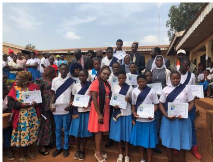
Collège St. François d'Assise, Bangang, 2018 (Département des Bamboutos)