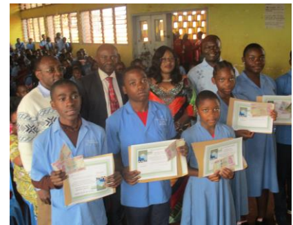
Lycée classique de Bafoussam, 2018 (Département de la Mifi)