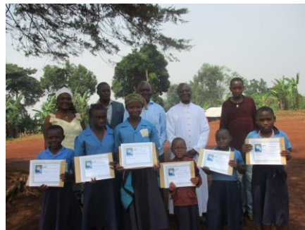
École Saint André de Bamendou, 2018 (Département de la Menoua)