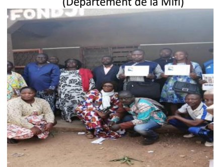
CES de Bangang Fondji, 2024 (Département de Koung Khi)