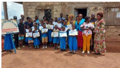
Government Bilingual Primary School, Bapa, 2023 (Département des Hauts Plateaux)