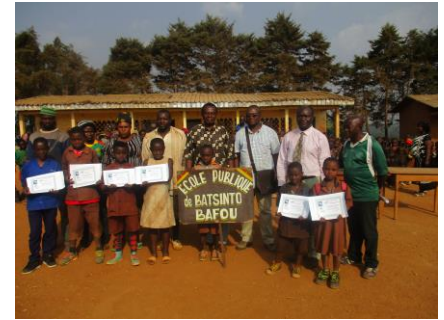
École publique de Batsinto, Bafou, 2017 (Département de la Menoua)