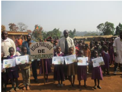
École publique de Tuelekuet, Bangang 2017 (Département des Bamboutos)