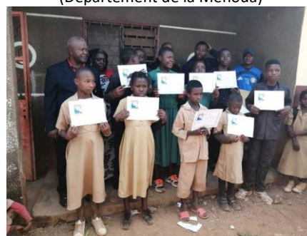
École Publique de Bangang Fondji, 2024 (Département de Koung Khi)