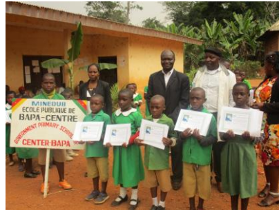
École publique de Bapa centre, 2017 (Département des Hauts Plateaux)