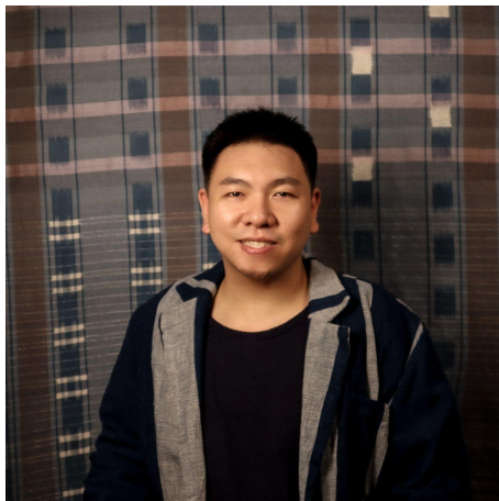
ผู้จัดการโครงการ (Project Manager)