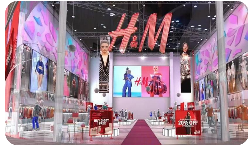
Concepto de tienda virtual de H&M