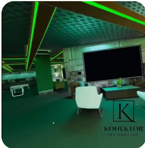
E-commerce de productos de CBD