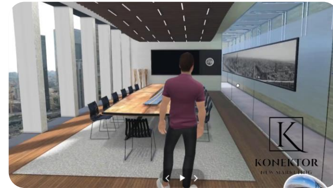
Sky Lounge Meeting Room