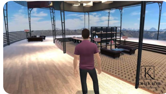
Oficina Virtual con vistas a la montaña