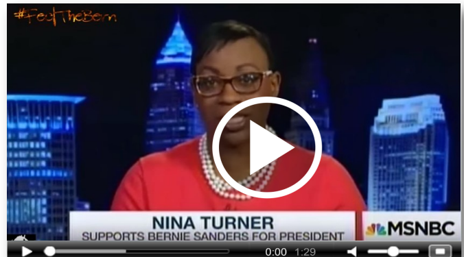
CNN, Don Lemon, Senator Turner debates multiple panelists