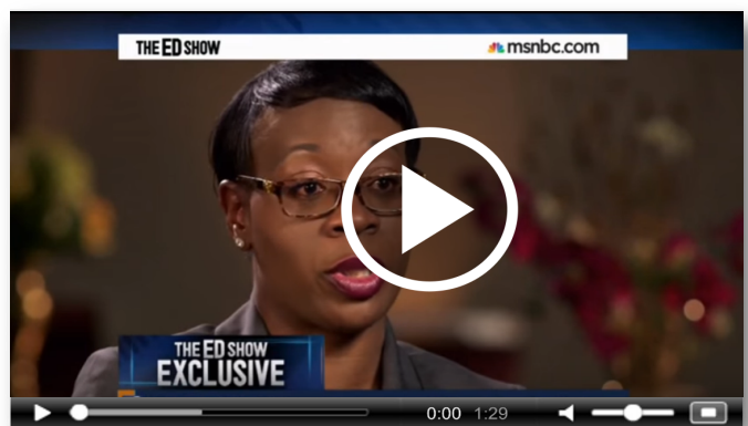
Who is Senator Nina Turner