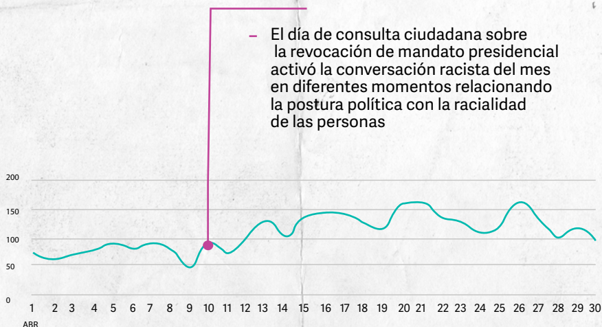
Gráfica 2. Volumen de mensajes sobre racialidad, racismo y/o clasismo, abril 2022.

En cuanto a los hitos que guiaron la conversación sobre racismo y racialidad en el mes de abril, la conversación no tuvo un gran detonador particular, sin embargo, sí se aprecia un aumento en los mensajes racistas a partir del 10 de abril, día de la revocación de mandato presidencial, activando la conversación en varios momentos posteriores. Pudimos ver el comportamiento orgánico de las expresiones racistas que se hacen comúnmente todos los días.