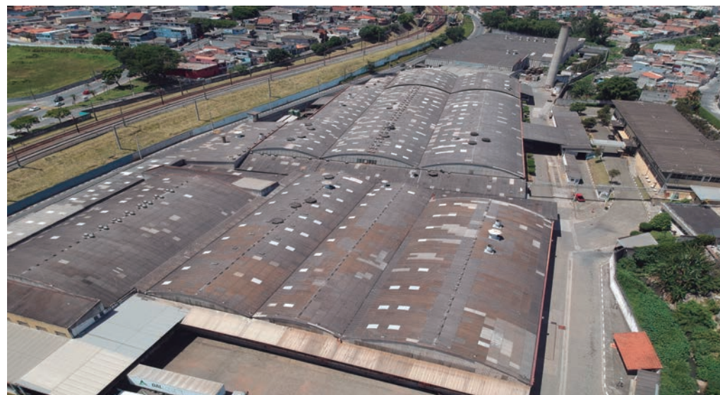
Fábrica da Nambei, localizada em Ferraz de Vasconcelos/SP, com 49.000m 2

Tradição, credibilidade e padrão de referência são algumas das expressões que resumem a essência da Nambei, um dos principais fabricantes de fios e cabos elétricos do país. Nós investimos constantemente na modernização do parque fabril, na qualificação de seus profissionais e no aprimoramento e desenvolvimento de uma completa linha de produtos, para garantir cada vez mais qualidade e segurança para seus clientes, possuindo uma linha completa de cabos para todas as aplicações industriais, comerciais e residenciais. Sob consulta, outros tipos construtivos de cabos poderão ser fabricados.