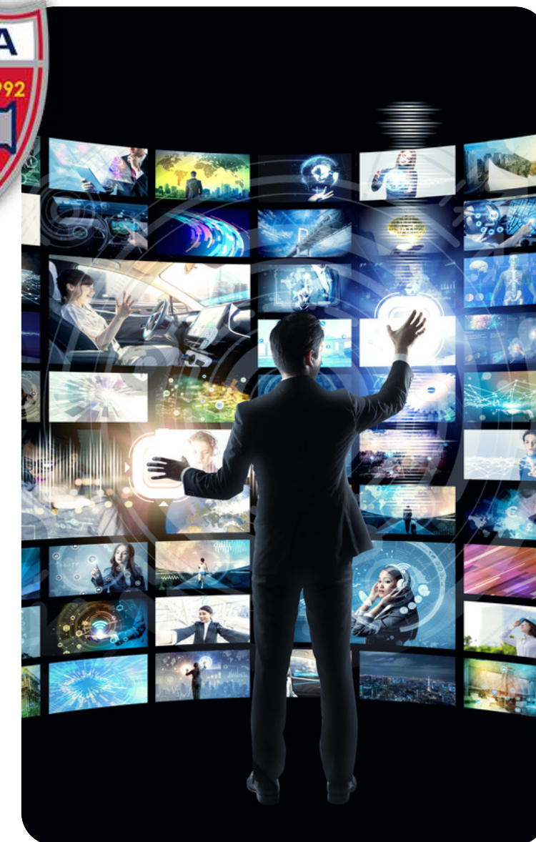
ANALISIS DE VIDEO