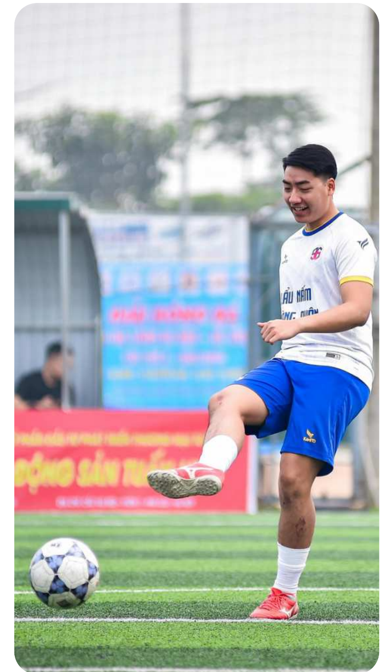
SEGUIMIENTO DEL RENDIMIENTO