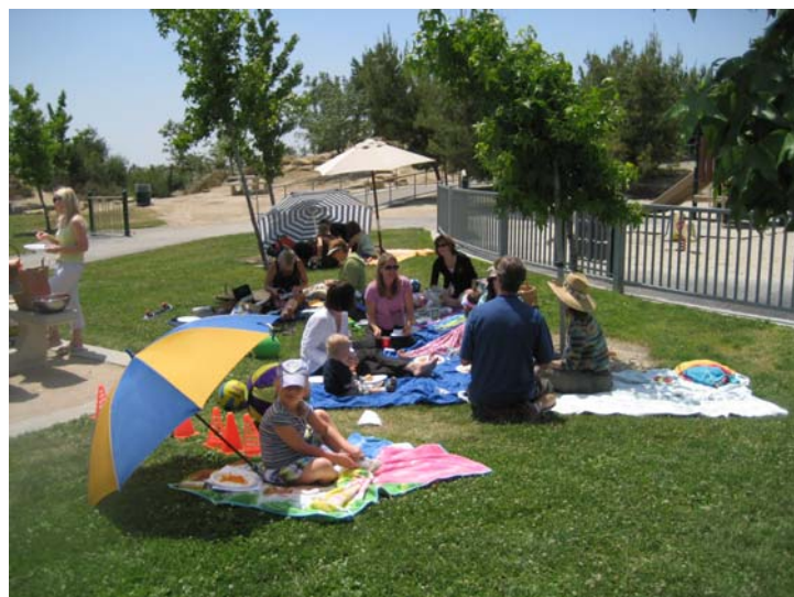
Pikniks uz sedziņām