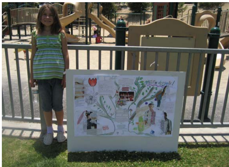
Adele Nagaine pie skolēnu pašu veidota dzejoļu plakāta

Kā šo spēli spēlē? Vispirms izvēlas dzejoļa tēmatu, piemēram, «Saulē» un «Koks».