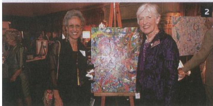
Pasadena Magazine, July 2008