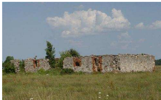
Tāds bija iesākums

Mājas teritorija – aptuveni 200 m 2 , no tiem 80 m 2 ir ēkas platība, tikpat liela ir jumta terase, pārējo veido mūra sienas un gaismas instalācijas. Šis mākslas darbs gaida pircēju, kas spēs novērtēt architektu darbu, kuri metuši tiltu no pagātnes uz nākotni. SIA «Balsts» Kalnciema ielā 41 Nekustamo īpašumu konsultante Kristīne Dubane tālr.: 371-67503434, kabatas tālr.: 271-26540371 e-pasts: kristine.dubane@balsts.lv www.balsts.lv