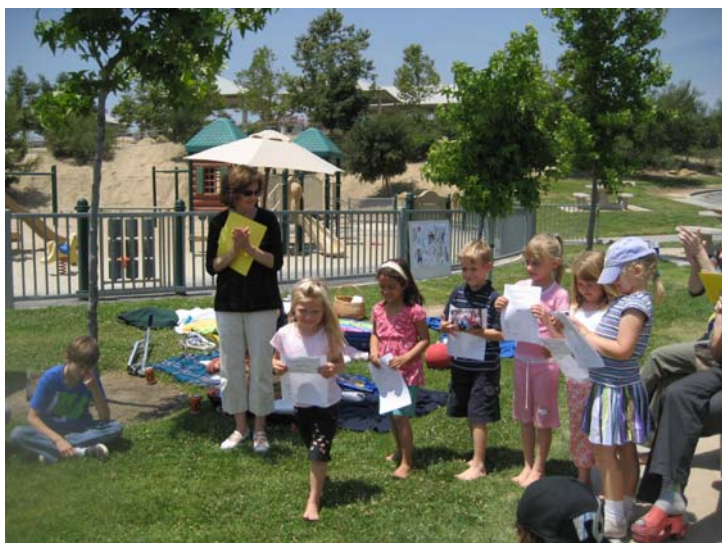
Mūsu «mazie zirņi» dejas arī Ventūrā