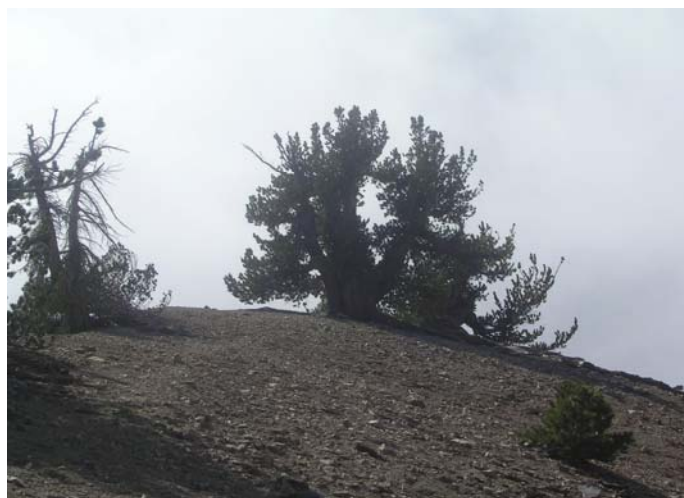
Izturīgākie koki Dienvidkalifornijā

Draudzes padome ir iepazinusies ar nekustamo īpašumu aģentiem, kuŗu uzdevums būs atrast dievnamam īrniekus (protams, ievērojot mūsu draudzes kalendāru). Īres maksa palīdzēs papildināt ienākumus. Baznīcu varēs sākt izīrēt pēc kritiskāko labojumu pabeigšanas, kuŗi cerams tiks izdarīti līdz gada beigām. Par turpmāko ziņosim nākamās Draudzes ziņās.