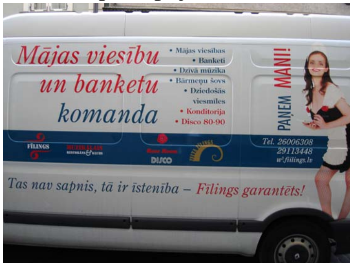
Rīgā uz kāda auto pamanīta reklāma