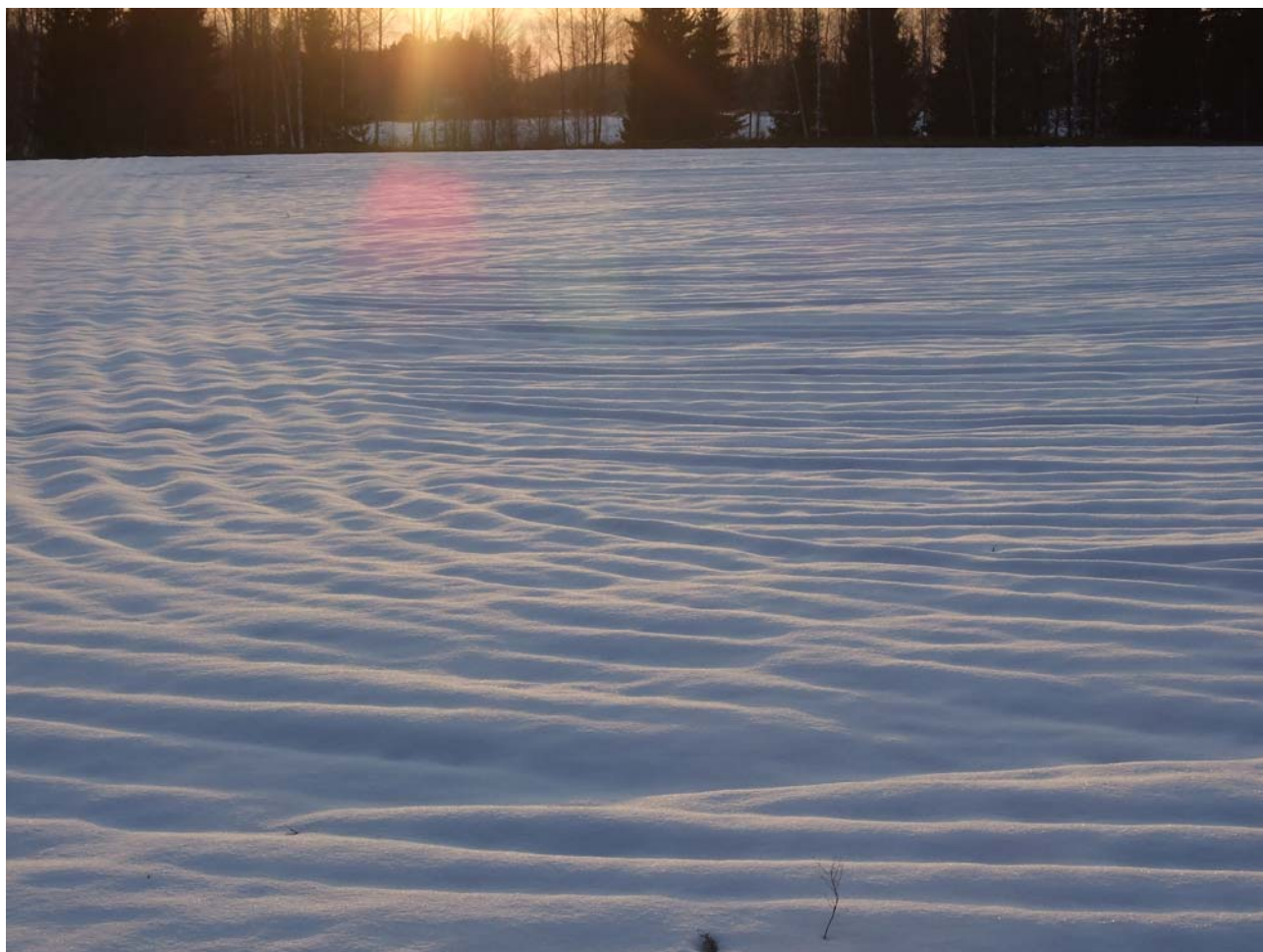
Ziemas sega Sēlijā

Lai jums veselīgs gads! Visi veseļosimies caur Kris-tus svētību, ko Viņš pelnījis pie krusta. Ikkatram grēci-niekam, kas grib atgriezties no grēka un nāves! Ja gribi būt vesels un priecīgs, ielāpi neder.