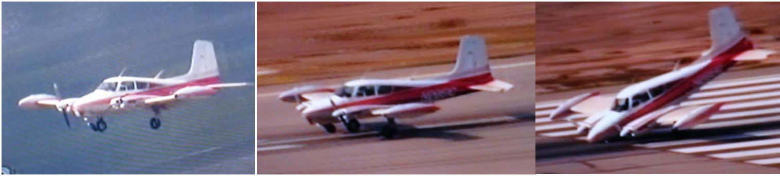
Mazās lidmašīnas drāmatiskās nolaišanās ainas rādīja arī televīzijā