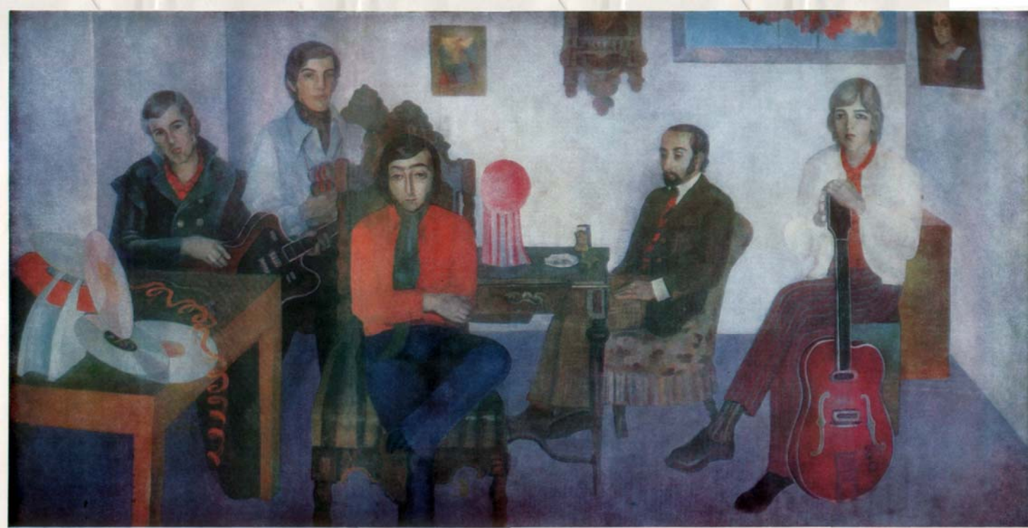
Maijas Tabakas glezna „Jokdaŗi”