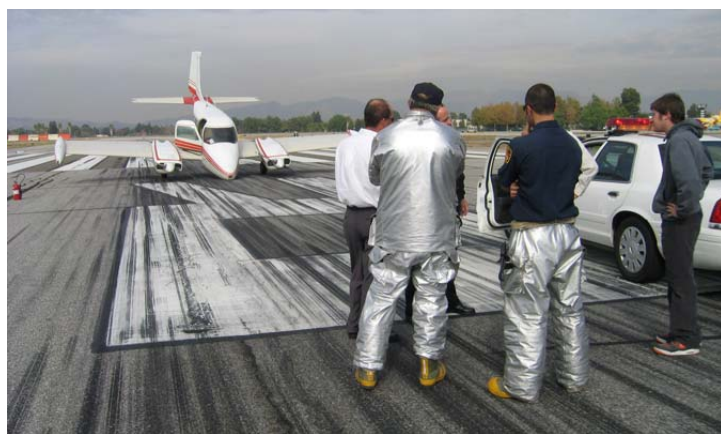
Lidmašīna laimīgi nolaidusies uz purna, ugunsdzēsēji gatavībā palīdzēt, ja tas būtu nepieciešams