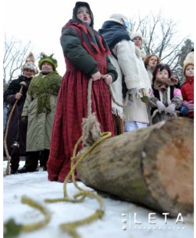
Bluķa vilkšana 21. decembrī Brīvdabas muzejā