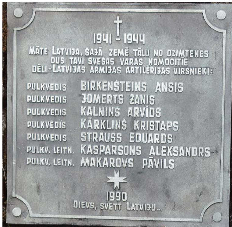
1990. gadā pie Lamas ezera uzcelts trīsstūrainis pieminekļis ar bronzas plāksnēm, kurās iegravēti visu nošauto virsnieku vārdi; piemiņas zīmes ir arī 14 lietuviešu un 15 igauņu virsniekiem