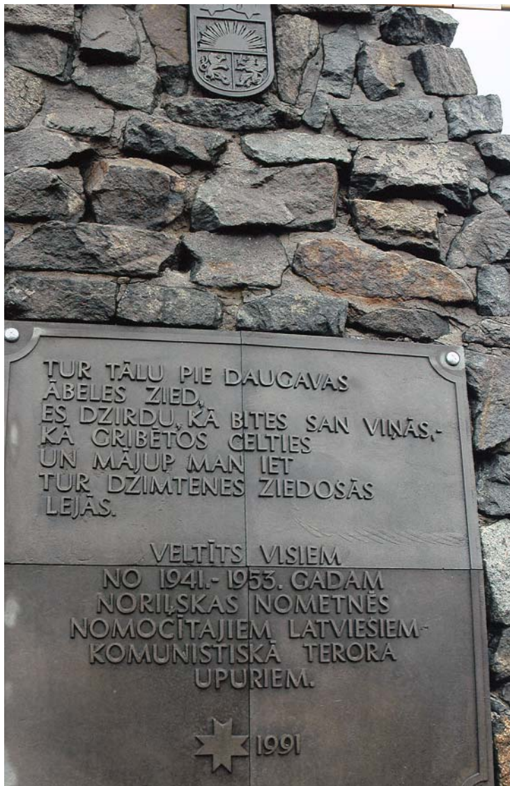
Uzraksts uz baltiešu pieminekļa Noriškā