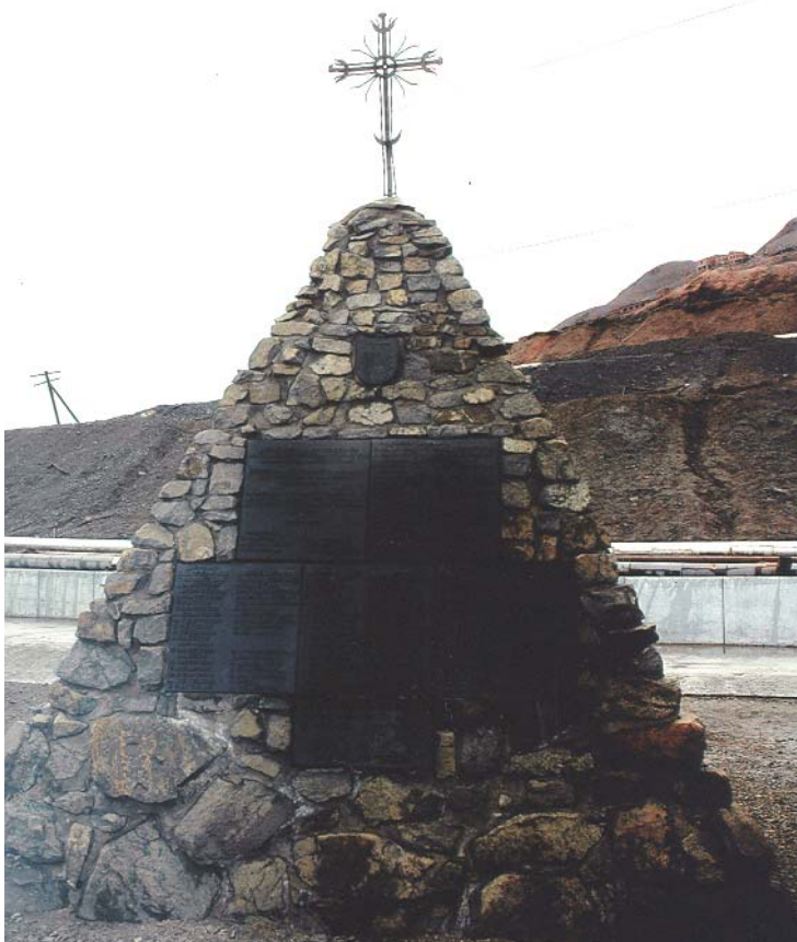
Piemineklis baltiešiem Noriļskas kaspētā

Nākamā rītā ar ātrlaivu devāmies uz Lamas ezeru, un mūs pavadīja četri televīzijas žurnālisti, feldšeris,