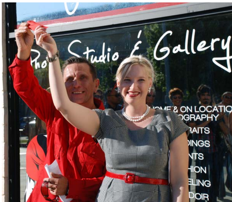
Sarkanā lente ir pārgriezta. Lai veicas!