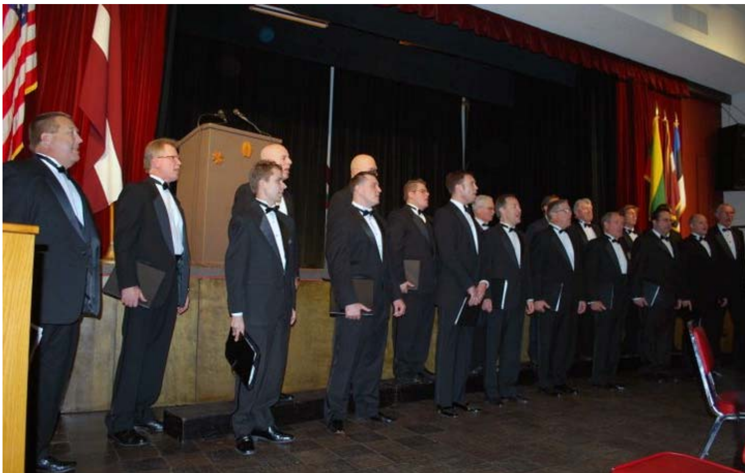
DK LB biedrības 60 gadu jubilejā dziedāja vīru koris „Uzdiedāsim, brāļi!”

Dienvidkalifornijas latvieši labprāt atbalsta biedrību, apmeklē tās sarīkojumus. Biedrībā pēdējā laikā iestājušies vairāki jauniebraucēji un aktīvi darbojas valdē.