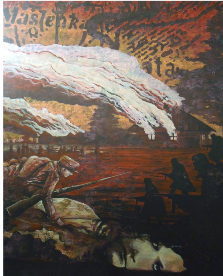
Ēriks Jerumanis „Masleņku traģēdija” (48" x 60", akrils, audekls)