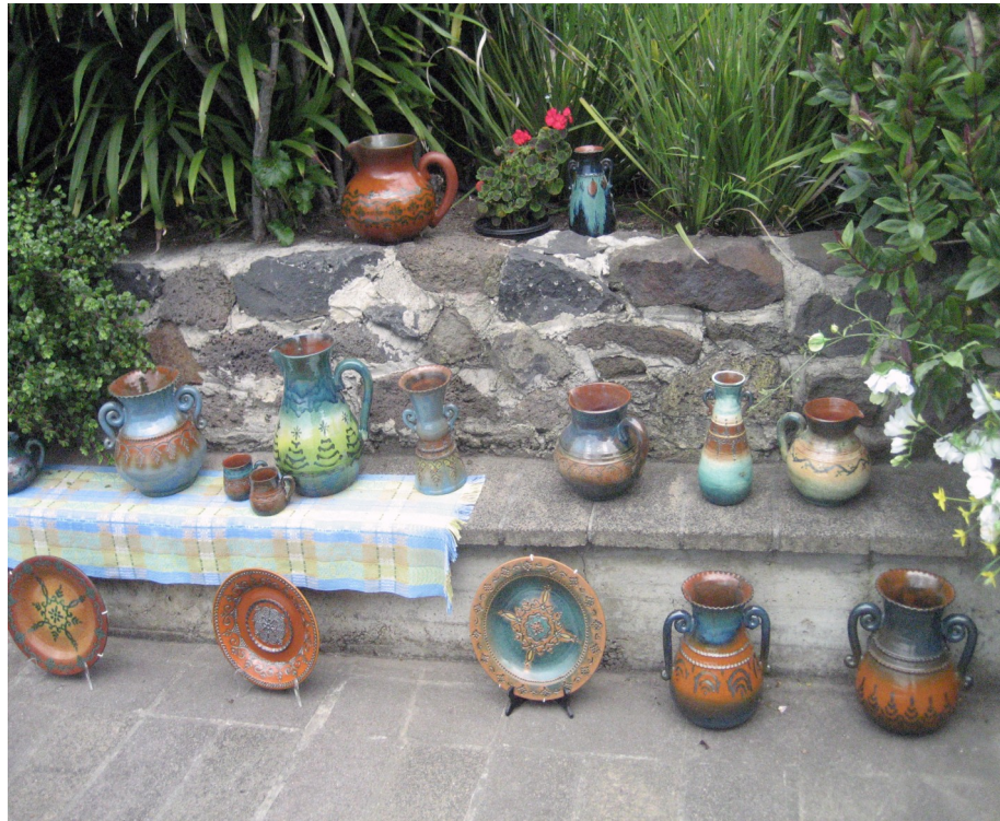
Te redzama tikai neliela daļa no Natālijas Neiburgas darbu izstādes Kultūras dienās viņas mājā pie peldbaseina