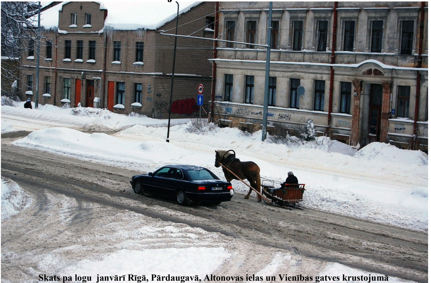
Skats pa logu janvārī Rīgā, Pārdaugavā, Altonovas ielas un Vienības gatves krustojumā