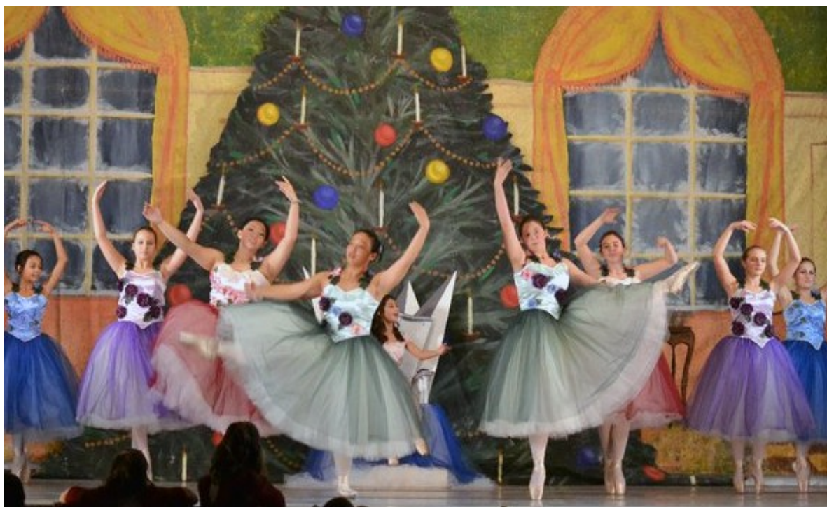
Curtis Studio of Dance „Riekstkoža” uzvedums Karpintērijā