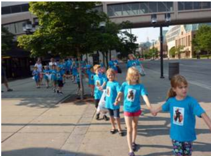
Čikāgas mazo dejojātāju gājīens