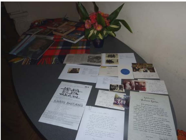
Uz galda mūzejā bija novietotas Ilmara Bastjāņa grāmatas, vēstules un citi rakstu darbi