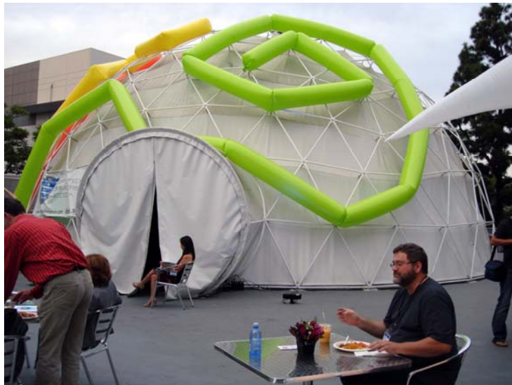
Vortex Dome, kur notika baleta „Zilais ābols” izrāde