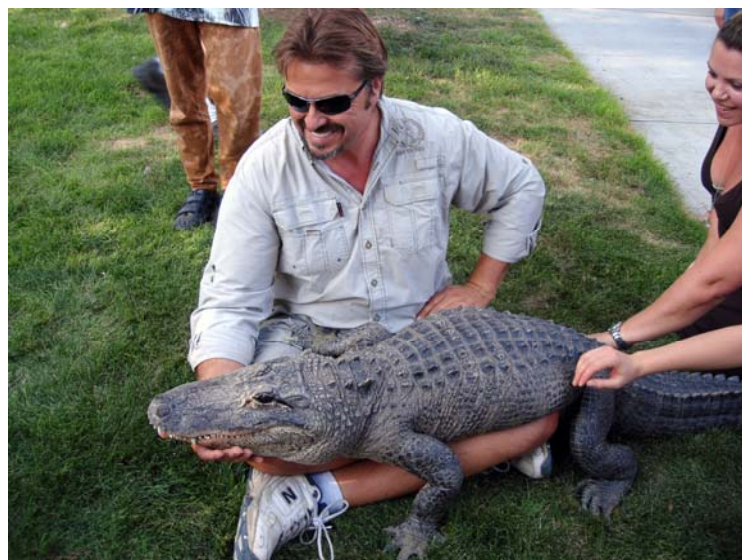
Drosmīgākie iepazīs ar aligatoru un pat viņu paglaudīja. Paēdis aligators ir flegmatisks, viņa āda sausa un ne pārāk cieta; iespējams, glāsti viņam vajadzīgi un patīk