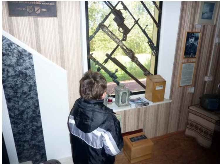
Leģionāru piemiņas istaba (mājiņā pretīm baznīcai)