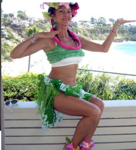
Anda – hulas dejojāja