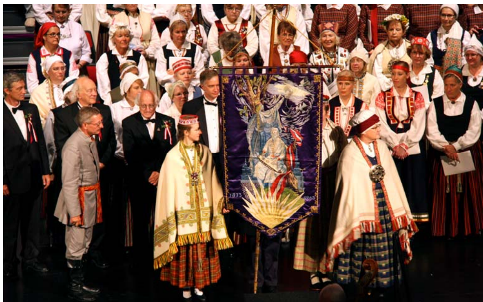
Dziesmu svētku karogs nodots hamiltonieŗiem. Kad Dziesmu svētku atkal būs Losandželosā?