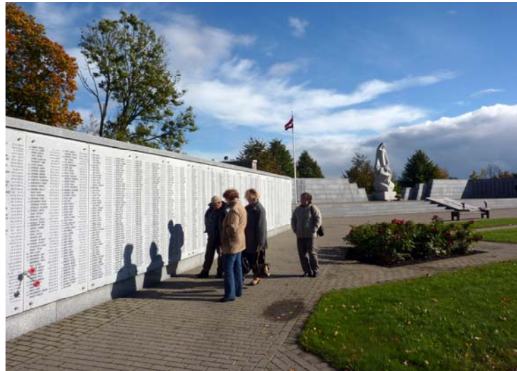
Siena ar kritušo vārdiem Kurzemes Brāļu kapos Lestēnē