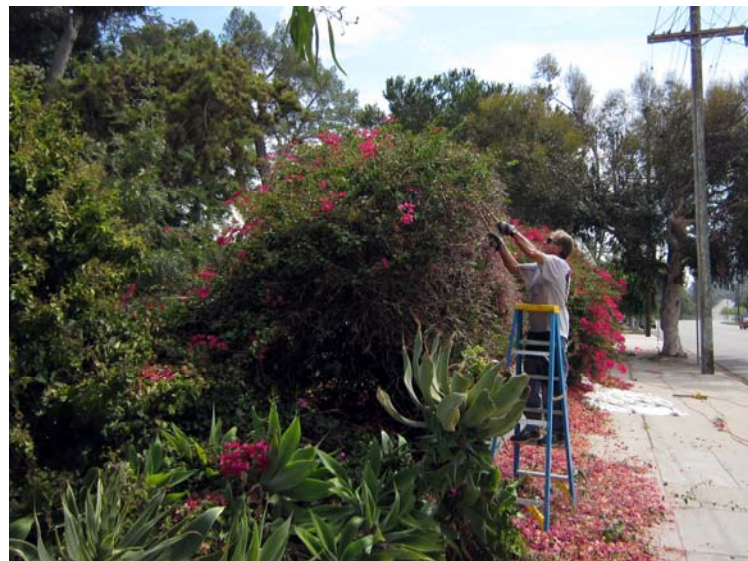
Juris Riekstiņš apgriež bugenviliju krūmus