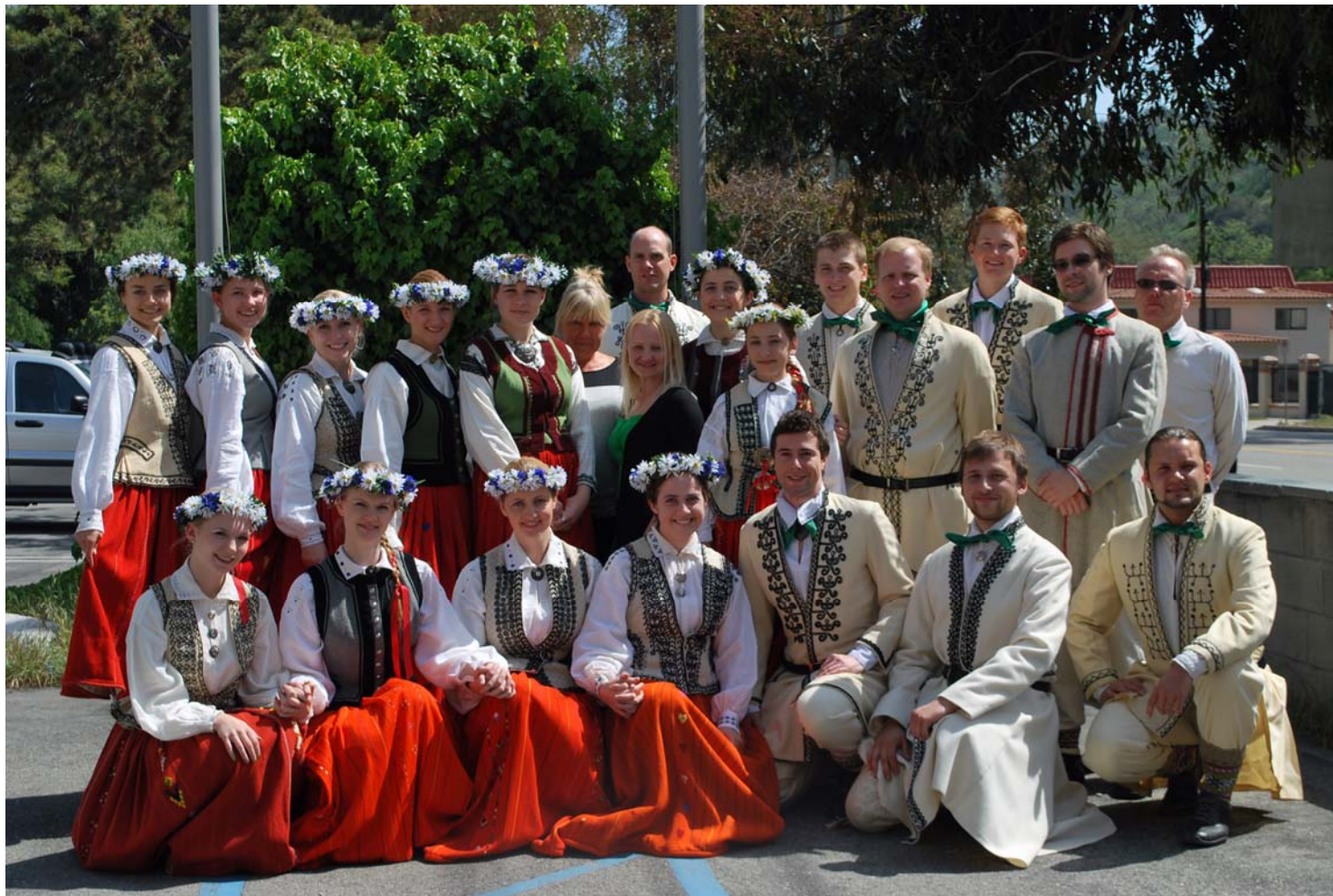
Tautasdeju kopa „Pērkonītis” 2013. gada 23. martā pie Losandželas latviešu nama