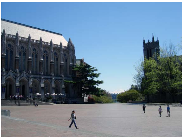
Vašingtonas universitātes bibliotēka; vidū tālumā redzama Reinīra kalna virsotne