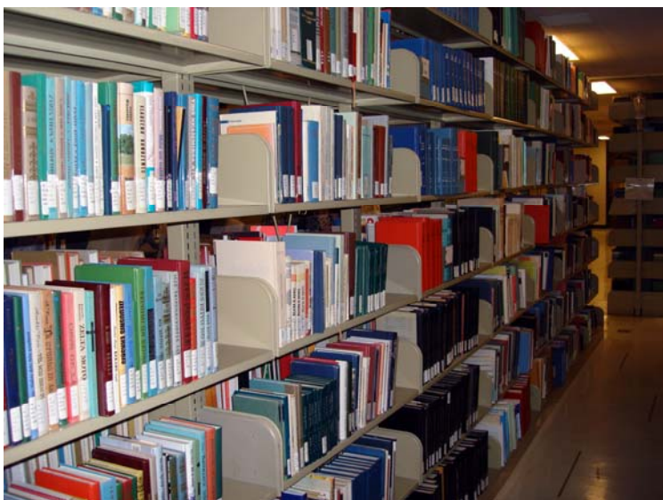
Latviešu grāmatas universitātes bibliotēkā

Par godu 100 gadiem fakultātē notika dažādas svinības un ozolu stādīšana. Trīsdesmit valstu konsuli, tostarp Latvijas konsuls ASV, 1932. gadā piedalījās ozolu stādīšanā līdzās tagadējai Allena bibliotēkai par godu Džor-