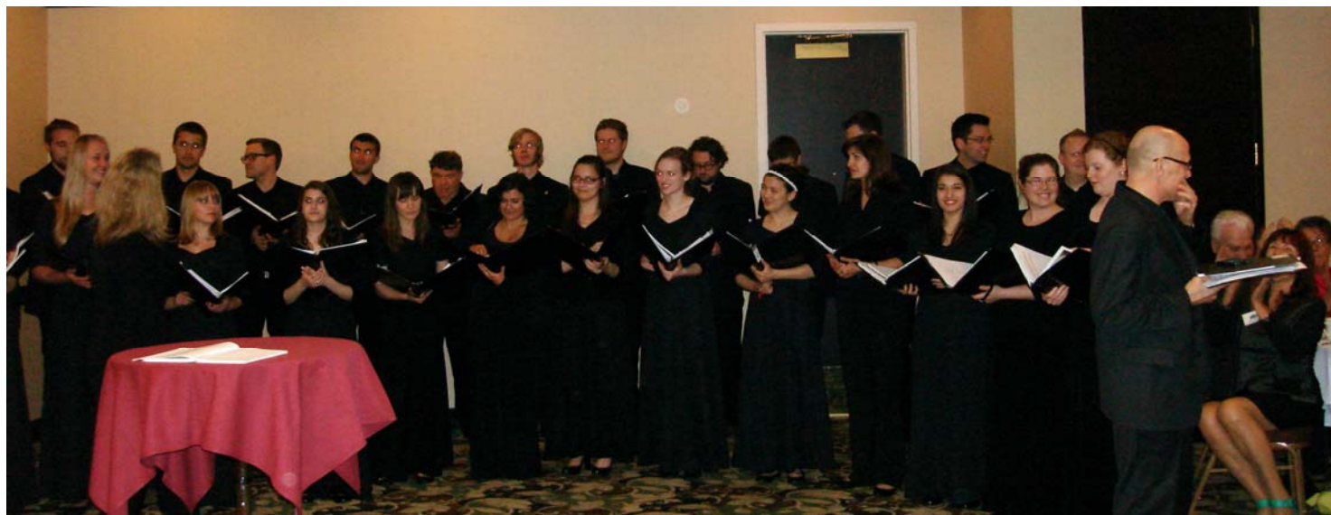
Dzied Vašingtonas universitātes kamerkoris