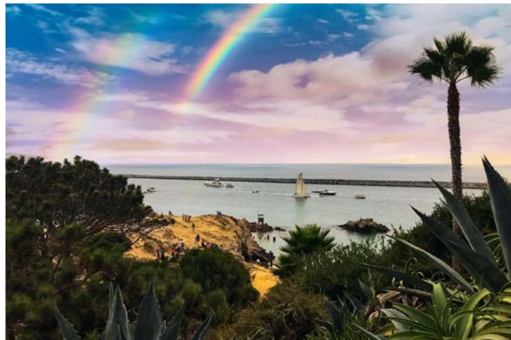
Corona del Mar