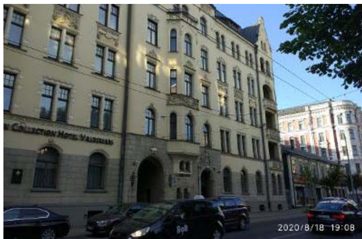
Ēka Krišjāņa Valdemāra ielā, kuŗā Eglīši dzīvoja 1919. gadā un piedzīvoja apšaudi bermontiādes laikā