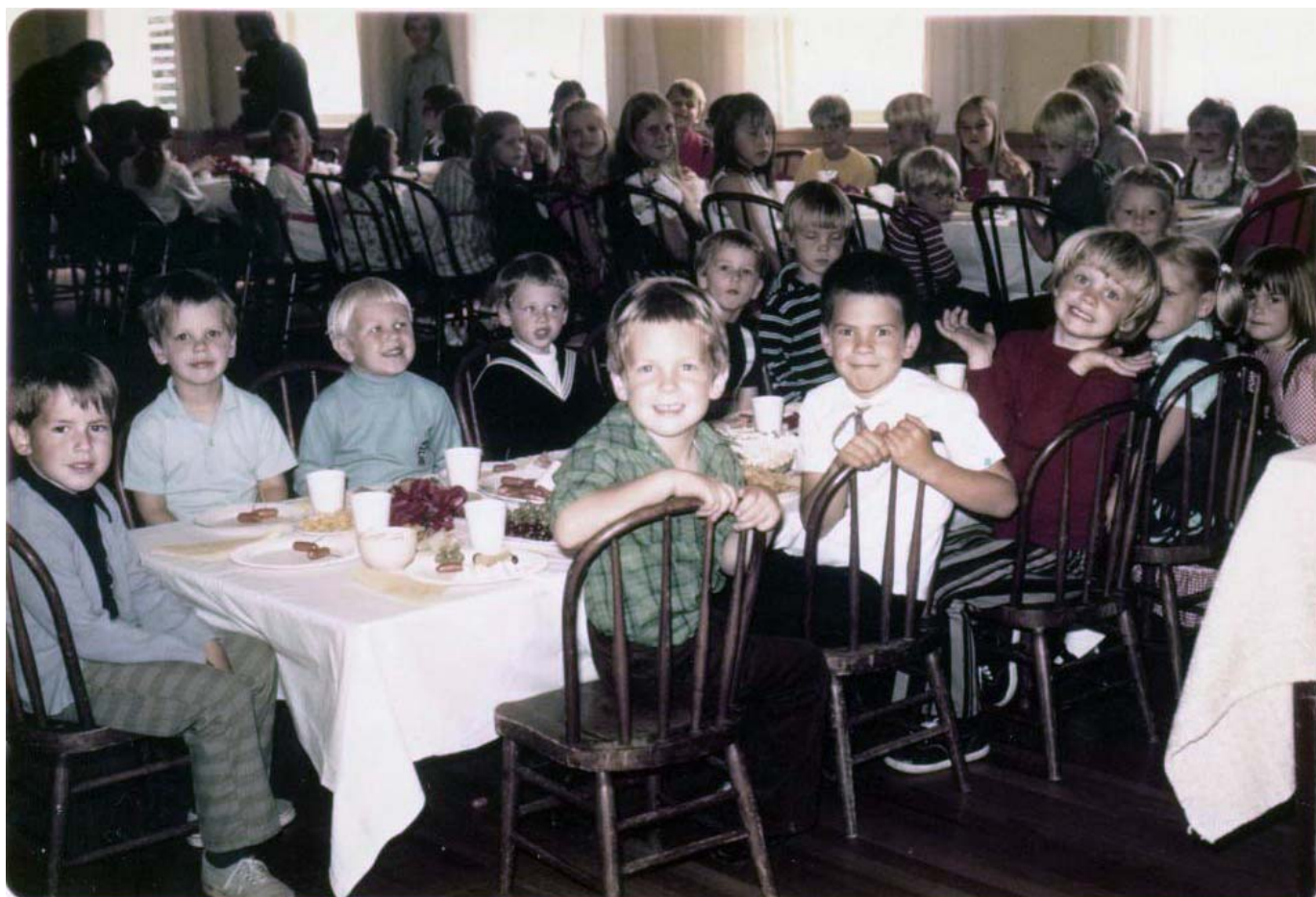
Losandželosas latviešu skolas 1971./72. mācību gada audzēkņi

Losandželosā bija latviešu skola. Atceros, māte un tēvs mūs veda uz lielu, vecu baznīcu, kam līdzās bija skaists dārzs. Baznīcas augšstāvā bija telpa ar lieliem logiem. Tā bija sadalīta ar salokāmām, zaļganām stikla plāksnēm, kam nedrīkstējām pieskarties, jo tās viegli varēja apgāzt. Lejā notika dievkalpojums, un mums pieteica būt klusiem, neskraidīt pa koka grīdu, jo visu, kas notika augšā, lejā varēja dzirdēt. Nedrīkstēja lēkāt vai skaļi kliegt. Skolā bija dažāda vecuma bērni, vairāki gaŗaki par mani. Es laikam biju bērnudārzā, jo telpā bija nelieli krēsli. Pieaugušo krēsli mums vēl nederēja. Pēc stundām mums vajadzēja palīdzēt augstelpu satīrīt