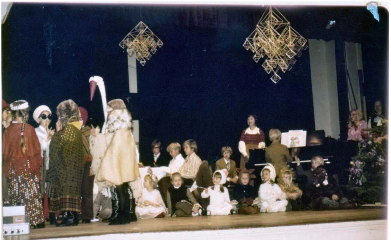
Ziemsvētku sarīkojumā viss gluži tāpat kā mūsdienās!