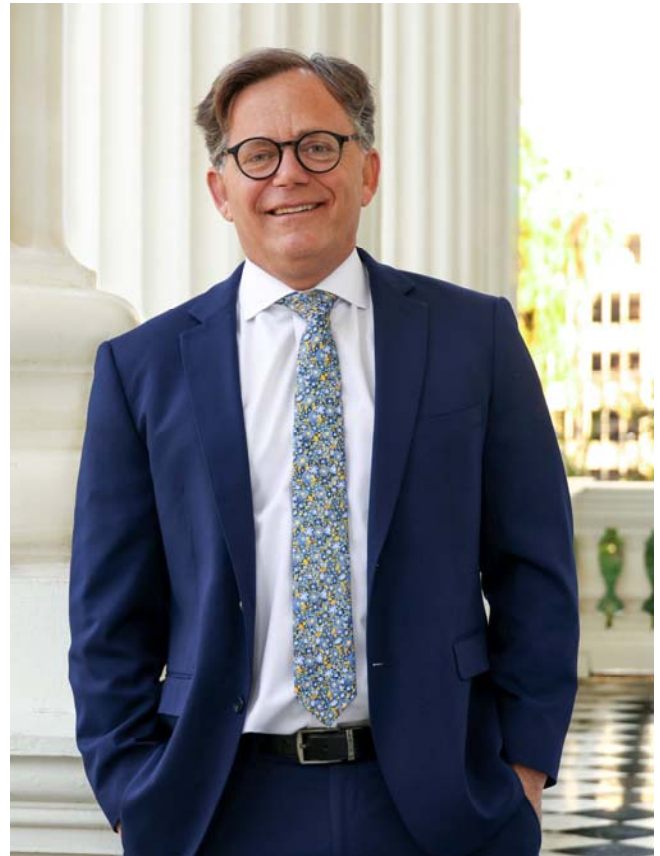
Senator Josh Newman

Resolved, That the Secretary of the Senate transmit copies of this resolution to the Governor and the Lieutenant Governor.