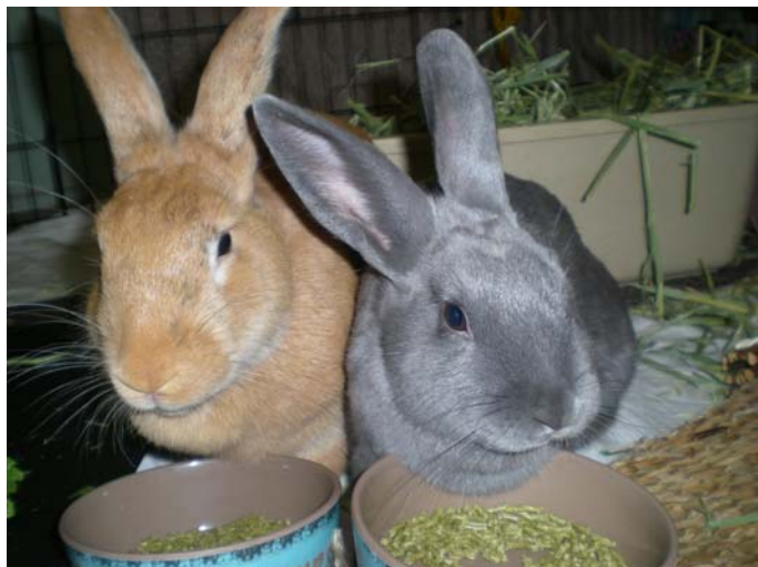
No kr.: Saulie un Enina