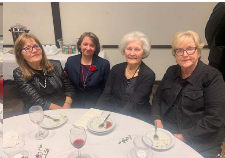
Neviens neaiziet pavisam, mīlestība paliek...