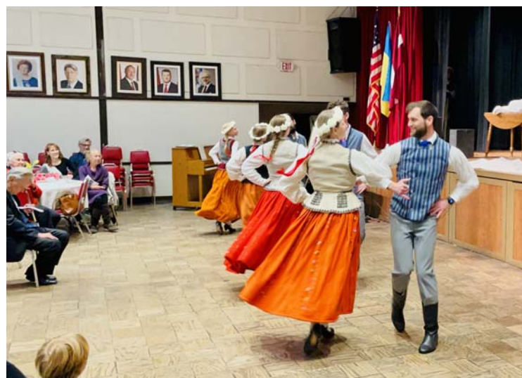
Tautasdeju kopa „Pērkonītis” dejo „Salti vēji pūta”; Jāņa Purviņa choreografija