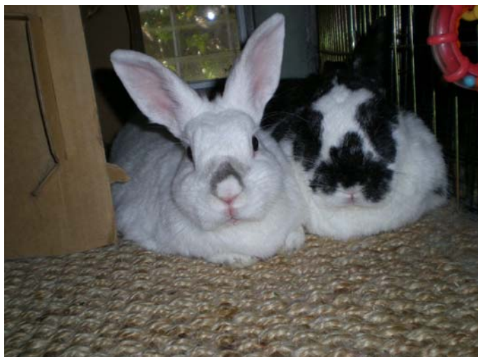
No kr.: Apasionata un Orlando