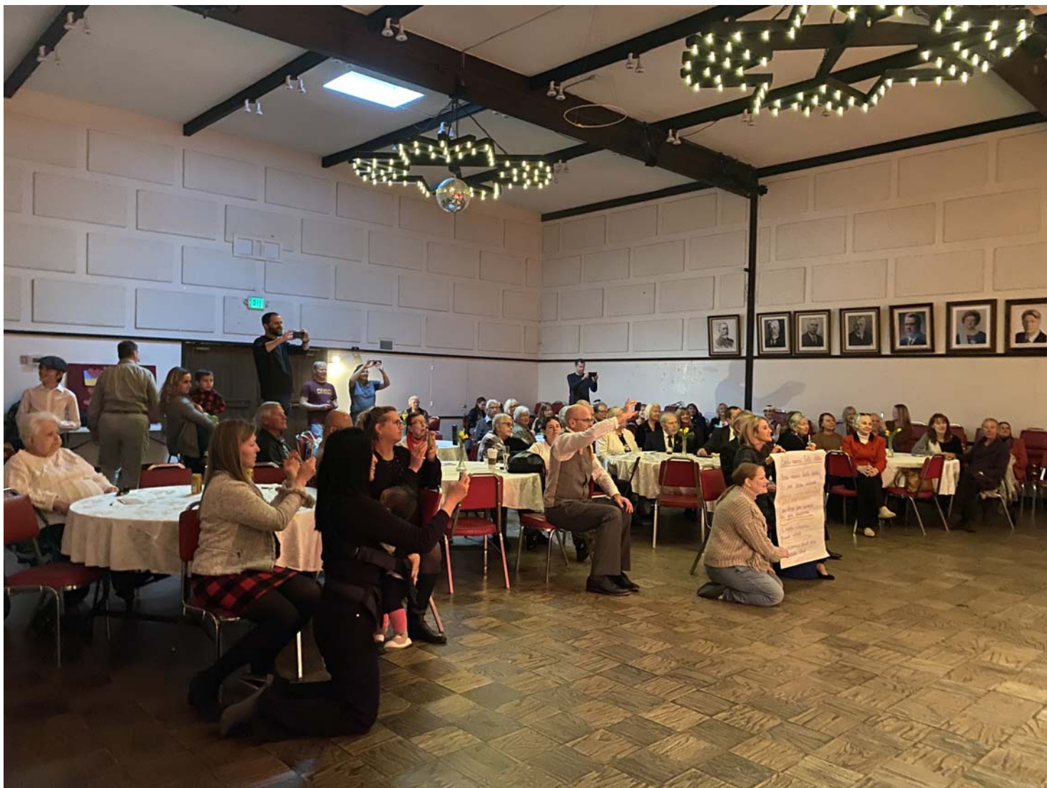
Sarīkojuma apmeklētāji dzīvi sekoja līdzī uz skatuves notiekošajam