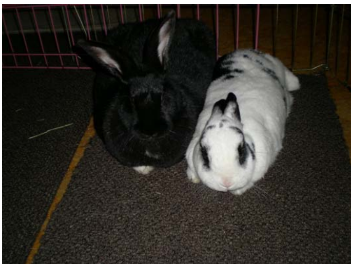
No kr.: Nipsītis un Vanillabīna