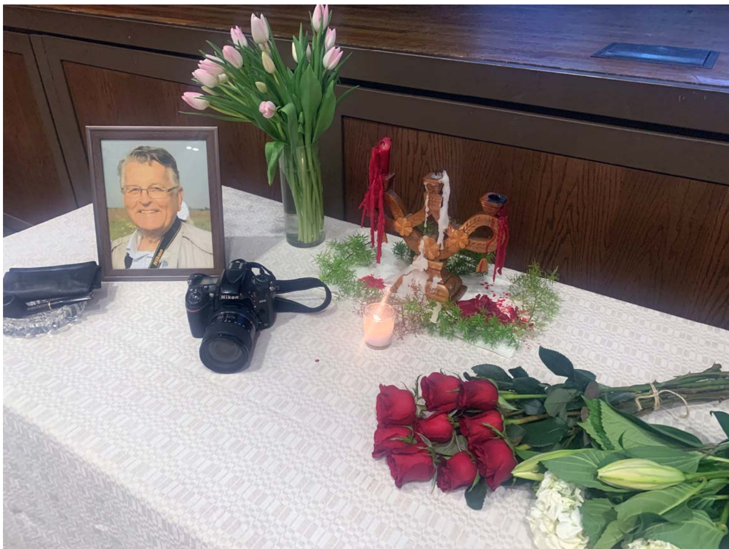
Atvadišanas turpinājās Losandželosas latviešu namā, kur bija klāts mielasta galds