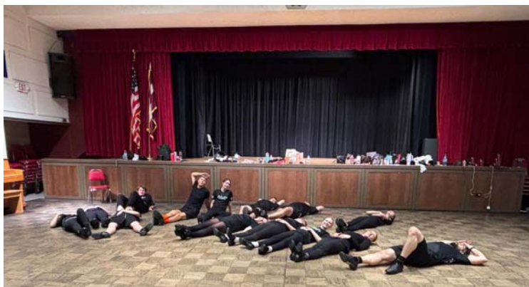
Reizēm vajadzēja atpūsties...