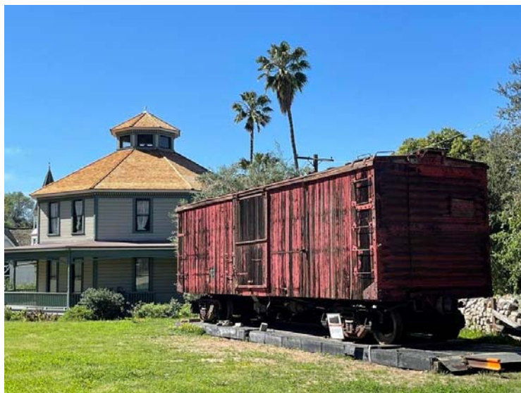
Heritage Square Losandželosā