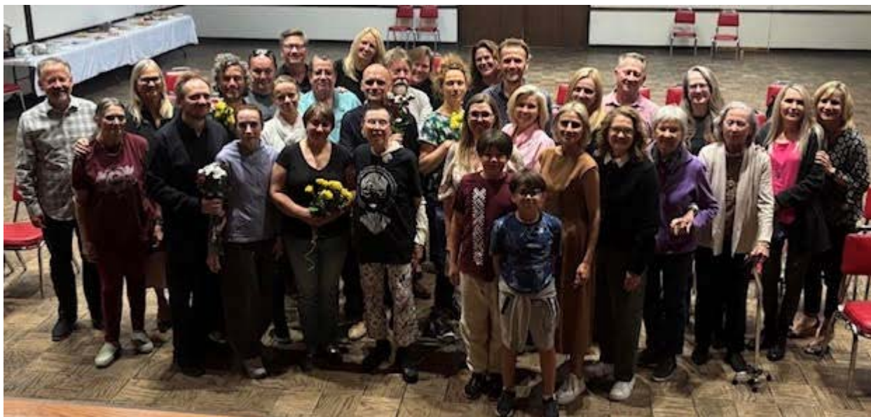
Willa teātra izrādes noskatīties atbrauca pulciņš teātrmīļu

Izrāde rosināja domāt par to, cik trausla ir cilvēka izvēļu pasaule, un kā viena lēmuma sekas var ietekmēt dzīves virzību, atklājot gan cilvēcisko vājumu, gan spēju būt atbildīgam un pielāgoties izmaiņām.