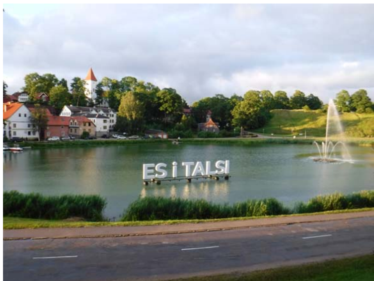
Skats uz baznīcu pie Talsu ezera