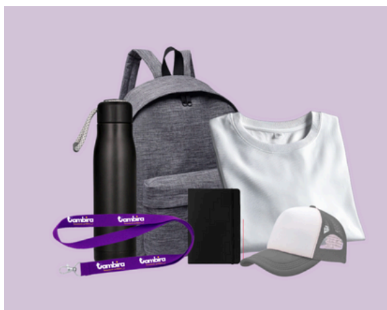
Kit de regalos Personalizados

Porque no solo buscamos proteger a tu equipo, también queremos ayudarte a conectar con tu audiencia. Creamos productos personalizados que mantienen tu marca presente de manera práctica y memorable.