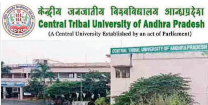
కేంద్రీయ గిరిజన విశ్వవిద్యాలయం

ఆంధ్రప్రదేశ్ లో గిరిజన విశ్వ విద్యాలయం ఏర్పాటులో తొలుత తీవ్ర గందరగోళం ఏర్పడింది. రాష్ట్ర ప్రభుత్వం తొలుత కొత్తవలస సమీపంలో 526 ఎకరాల భూమిని కేటాయించింది. కొన్ని పనులు కూడా చేశారు. కానీ గిరిజన ప్రాంతంలోనే ఏర్పాటు చేయాలని ఏపీ ప్రభుత్వం తర్వాత భావించింది. దానికి తగ్గట్టుగా పంపించిన ప్రతిపాదనలు కేంద్ర ప్రభుత్వం ఆమోదించిన తర్వాత విజయనగరం జిల్లా సాలూరు సమీపంలో విశ్వ విద్యాలయం ఏర్పాటుకి కేంద్రం అనుమతి లభించింది. దుగ్గి సాగరం గ్రామ సమీపంలో 354 ఎకరాల విస్తీర్ణం భూమిని ఏపీ ప్రభుత్వం కేటాయించింది. 2019లో యూనివర్సిటీ కార్యకలాపాలు ప్రారంభమయ్యాయి. విజయనగరంలోని ఆంధ్రా యూనివర్సిటీ పీజీ సెంటర్ లో ప్రస్తుతం క్లాసులు జరుగుతున్నాయి. త్వరలో శాశ్వత భవనాల నిర్మాణం ప్రారంభిస్తామని విశ్వవిద్యాలయం అధికారులు చెబుతున్నారు.