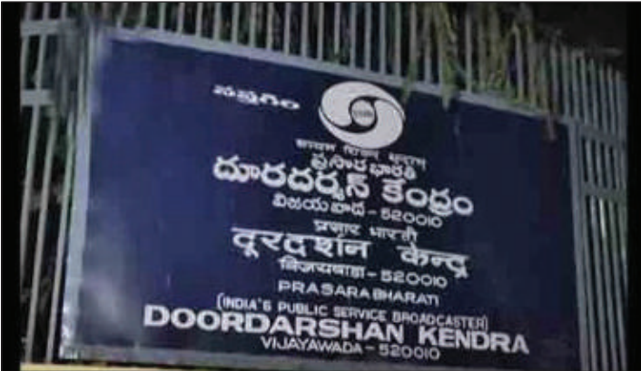
దూరదర్శన్ కేంద్రం, విజయవాడ