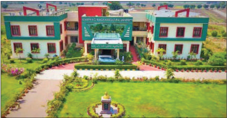
వ్యవసాయ విశ్వవిద్యాలయం, గుంటూరు

కేంద్రం విభజన చట్టంలో పేర్కొన్న వ్యవసాయ విశ్వవిద్యాలయాన్ని గుంటూరు జిల్లాలో ఏర్పాటు చేశారు. హైదరాబాద్ లో ఆచార్య ఎన్టీరంగా యూనివర్సిటీ 1964లో ఏర్పాటు చేశారు. అది తెలంగాణ పరిధిలో ఉండటంతో రాష్ట్ర విభజన తర్వాత దాని పేరును ఆచార్య జయశంకర్ యూనివర్సిటీ అని మార్చారు. ఆంధ్రప్రదేశ్ లో అప్పటికే గుంటూరుజిల్లా లామ్ వద్ద వ్యవసాయ పరిశోధనా కేంద్రం ఉంది. అందులోనే కొత్తగా ప్రతిపాదించిన వ్యవసాయ యూనివర్సిటీ ప్రారంభించారు. తరగతులు జరుగుతున్నాయి. 2015లో పలు భవనాలకు శంకుస్థాపన జరిగింది. కొన్ని భవనాలు అందుబాటులోకి వచ్చాయి.