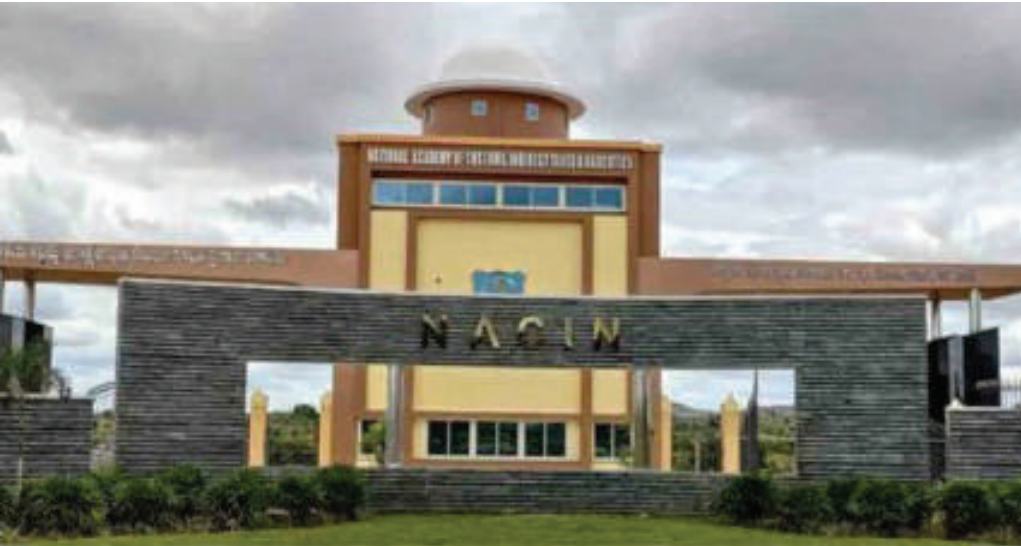
నేషనల్ అకాడమీ ఆఫ్ కస్టమ్స్ అండ్ నార్మోటిక్స్, అనంతపురం