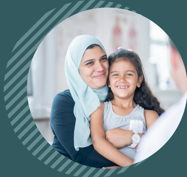
Accès, coordination, optimisation des services