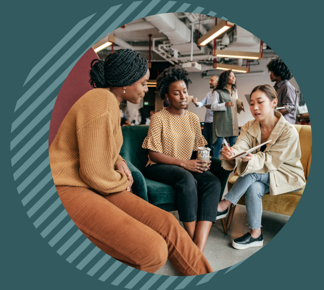
Appui aux personnes à statut précaire d'immigration