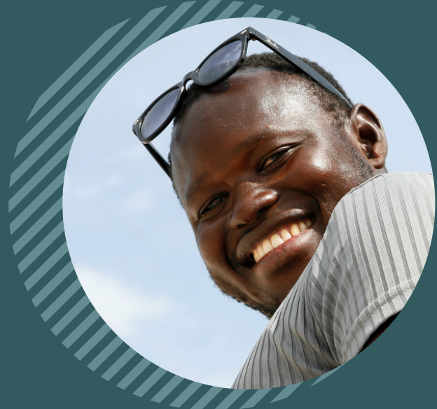
Intégration économique et l'employabilité