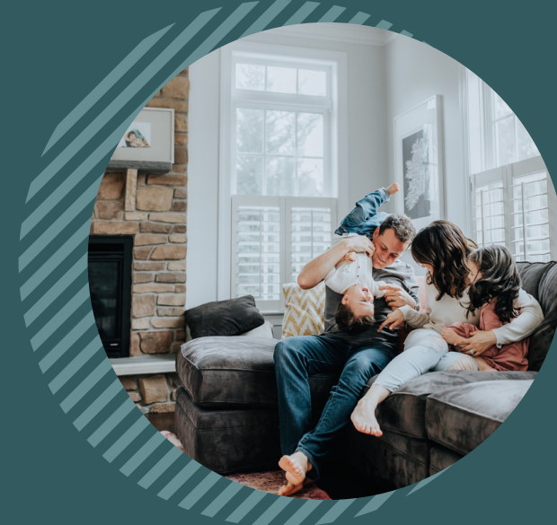
Accès au logement