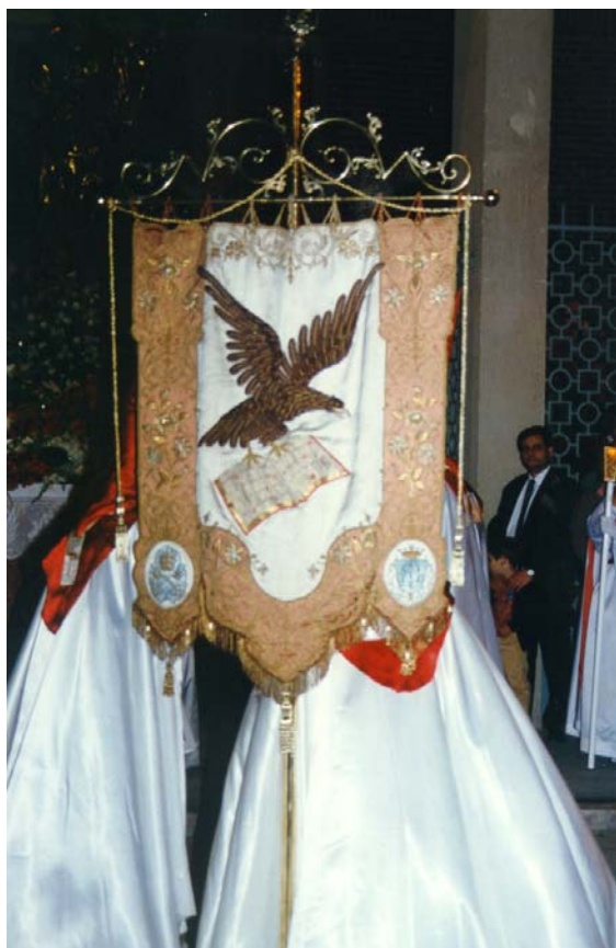
(Fotografía del Estandarte de la Hermandad).

tiempo ha pasado sobre ellas), se podía apreciar otros hermanos procesionistas que nos han precedido. Sin duda estas personas cuando se reconozcan en ellas (¡Dios mío, como nos cambia el paso del tiempo!) no podrían evitar una sensación de emoción contenida y a la vez de sana envidia. Emoción contenida al recordar y venir a su mente “su particular espíritu” procesionista, que en aquellos días les hacía hervir la sangre y les impulsaba a realizar cualquier objetivo que se plantearan, segu-