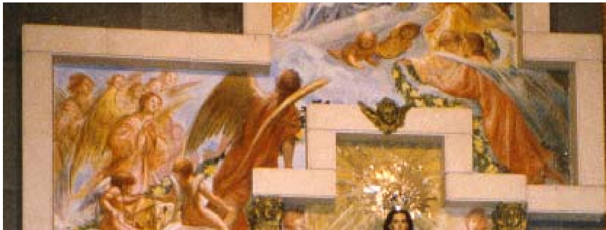
(Detalle de la Capilla de la Virgen del Rosario)