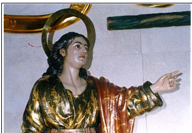
(Fotografía del Titular)

De pronto se agolparon en mi mente tal cantidad de recuerdos mientras conducía mi coche hacia casa. Ya eran la 0'30 h. de la madrugada y sin cenar. Pero a pesar de ello, los recuerdos, imágenes, momentos inolvidables, personas, etc. se iban paseando por mi mente como una película.