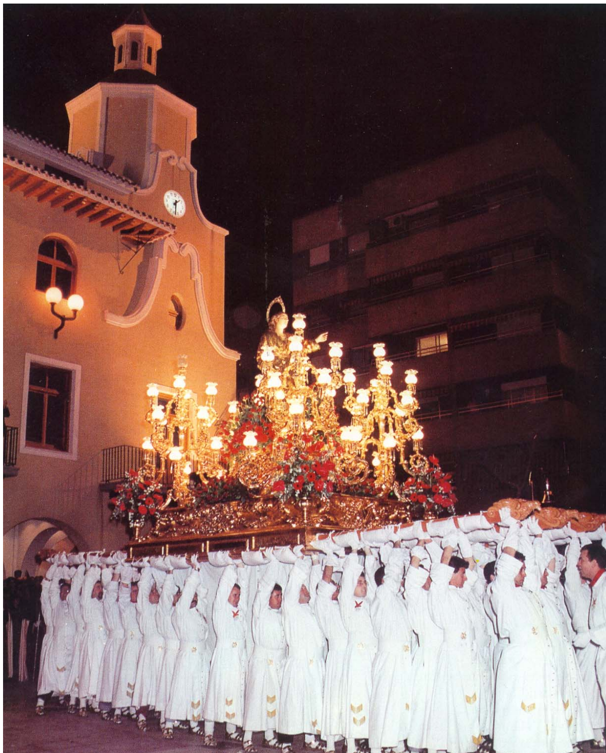
(Fotografía del Trono de San Juan en el momento de ser alzado por los portapasos)

Pero como quiera que parece que la polémica sigue latente, y en el seno de esta encontramos, dicho en términos de hermandad,