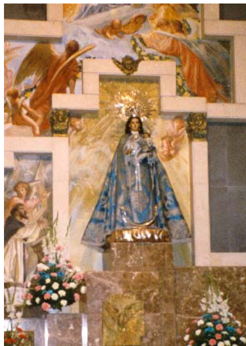
(Virgen Ntra. Sra. del Rosario)

En cuanto a la capilla a Ntra. Sra. del Rosario en la parroquia de San Pedro Apóstol,