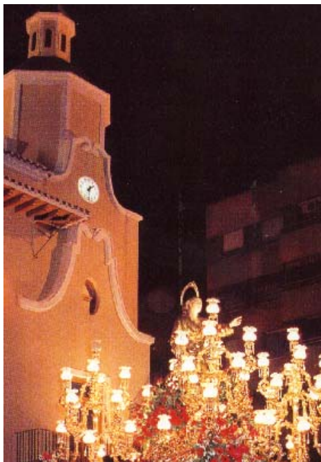
(Fotografía del Trono de San Juan al pie de la torre del Ayuntamiento)