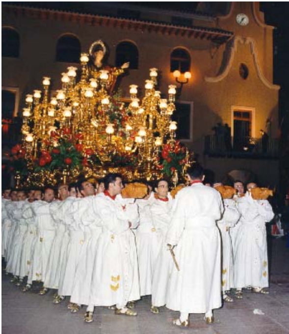
(Trono de San Juan Evangelista entrando en la Plaza de San Pedro, Jueves Santo).

Finalmente, comunicar que tal y como se decidió en la última reunión, este año no se realizará ningún acto de relevancia, para poder preparar una gran Semana Santa el próximo año, coincidiendo con el cincuenta aniversario de nuestra Hermandad.