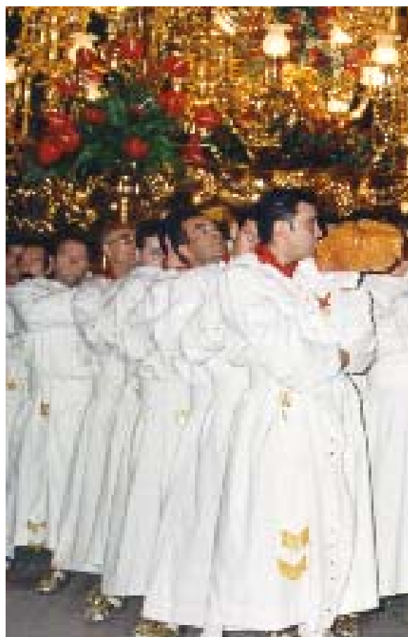
(Detalle de portapasos cargando).

cierto que todos olviden, pues mientras a la mayoría nos embargan los dictados del corazón, algunos, pocos gracias a Dios, dicen que gritar viva es impúdico, indecoroso, insultante y no sé cuantas “cariñosas” cosas más. Pues no señores, no, o acaso es impúdico gritar ¡¡ Viva España!!, o indecoroso ¡¡ Viva El Rey!!, o insultante ¡¡ Viva la Madre que me parió!!.