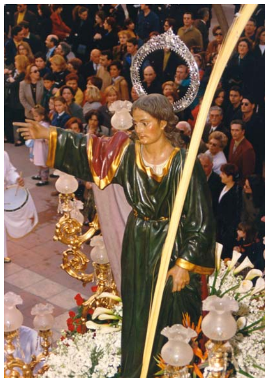
Iglesia de San Roque)

de otros Hermanos Sanjuanistas pudieron ver la luz en diciembre de 1.982, marzo de 1.984 y la última de ellas en septiembre de 1.989; todas ellas iniciaron su andadura como está, es decir, sin grandes pretensiones y solamente aspiraban a la continuidad, a servir de unión entre todos los sanjuanistas y a informar de lo que acontecía en nuestra Hermandad.