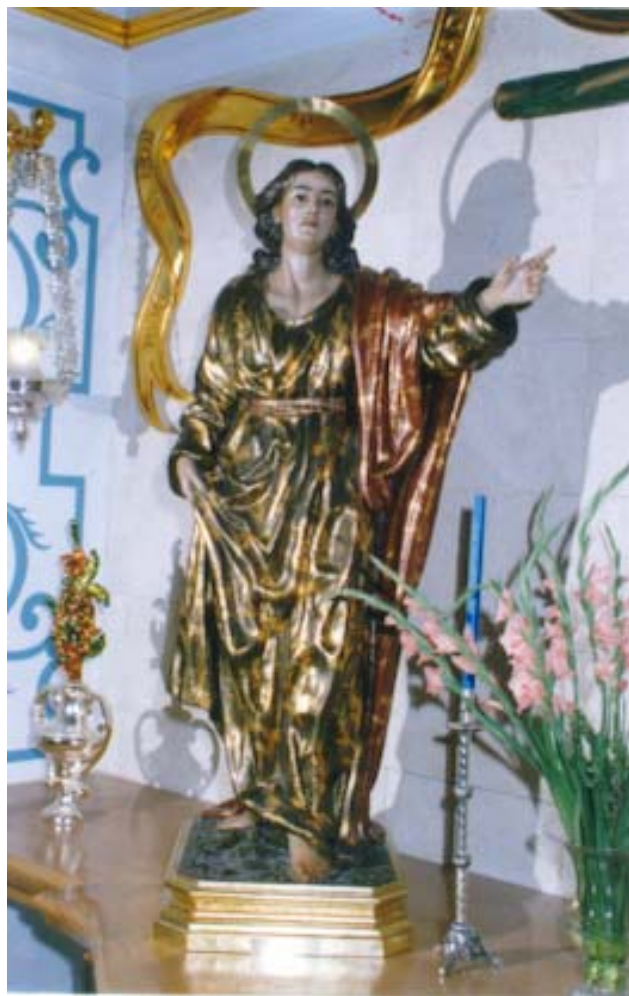
(Imagen de San Juan Evangelista, en su Capilla de San Pedro Apóstol).

A mis compañeros de directiva a los que aprecio enormemente, darles las gracias por acompañarme y respaldarme con tanto gusto, durante todo el año.