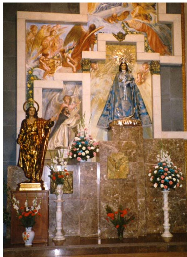
(Capilla de la Virgen del Rosario)

Desde quince días antes, los Hermanos Mayordomos han estado haciendo colecta domiciliaria que permita sacar a la calle la Procesión. Y nuestro