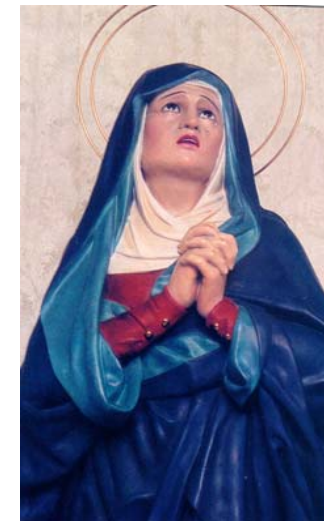
(Fotografía de la Virgen de las Lágrimas).