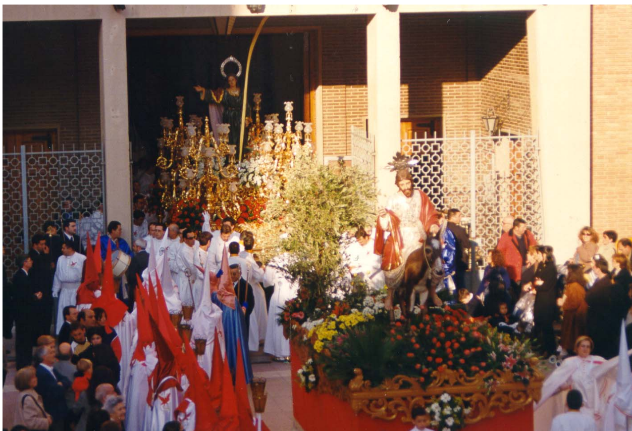
(fotografía del Cristo de la borriquilla y San Juan a la salida de San Pedro)