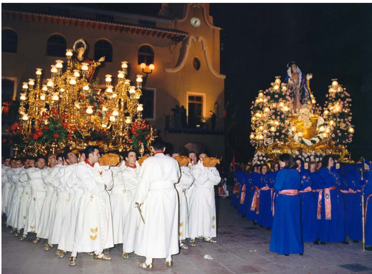
(Encuentro de San Juan Evangelista y la Virgen del Primer Dolor en la Plaza de San Pedro).