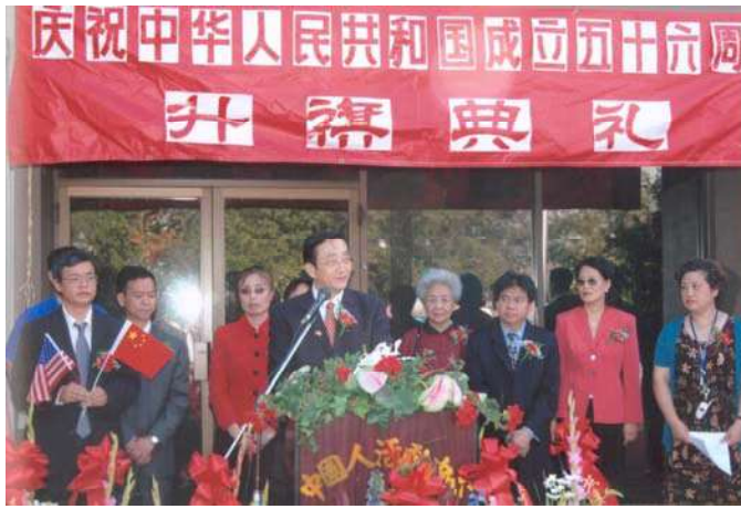
中国驻休斯顿总领事馆华锦洲总领事致辞