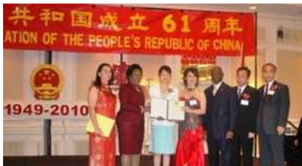
与美联邦众议员杰克逊·李

馆建设所做出的贡献。哈里斯郡法官艾默特颁发贺状，宣布 2010 年 9 月 26 日为“哈里斯郡庆祝中国国庆日”。