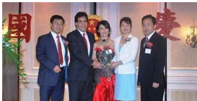
为上海世博会美国总代表费乐友颁奖