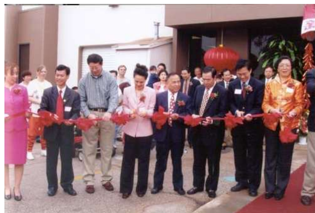
中国人活动中心举行盛大开楼仪式（二）