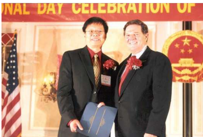
国会众议院多数党领袖汤姆迪雷先生颁送祝贺状