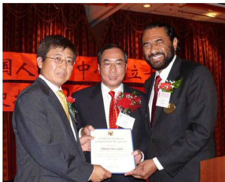
国会议员格林为活动中心赠贺函