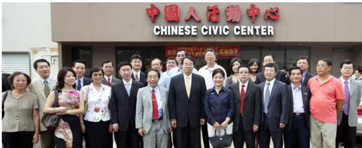
国务院侨务办公室副主任许又声和休斯顿中国人活动中心全体人员合影。