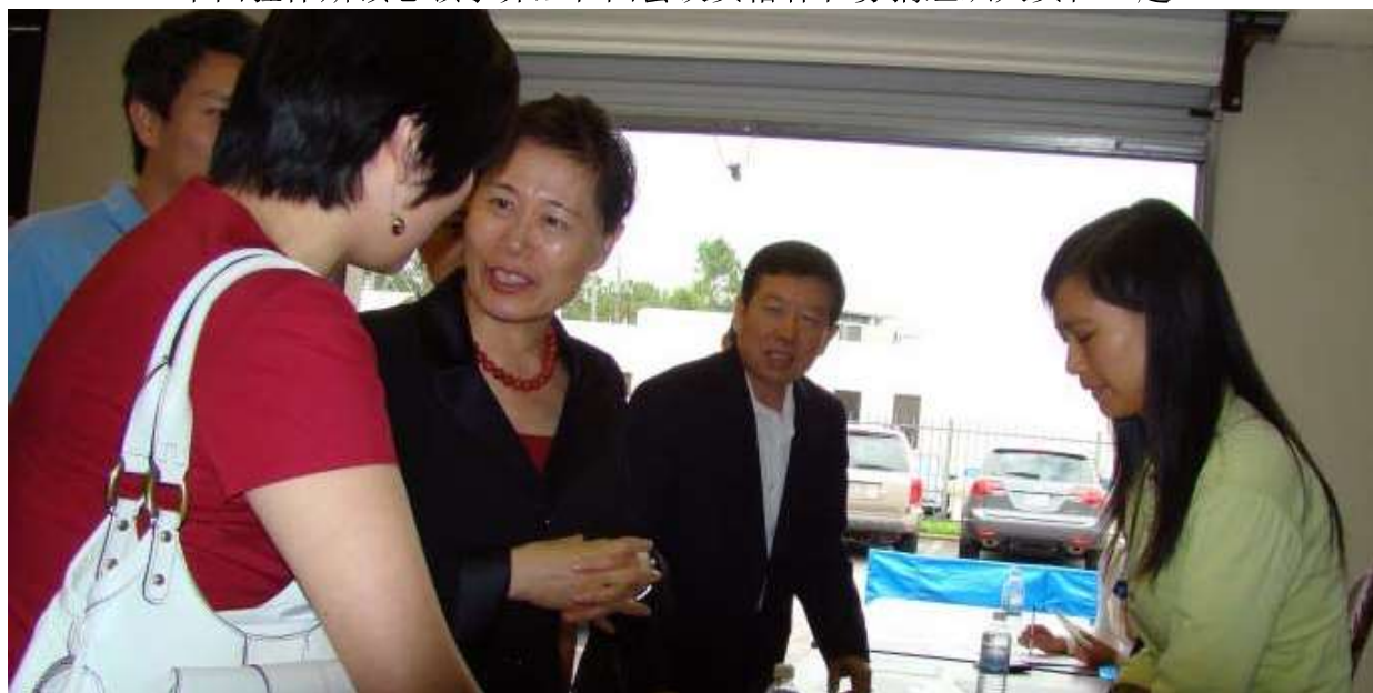
中国驻休斯顿总领事乔红和捐款人交谈。