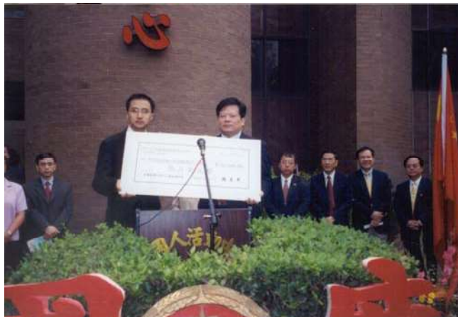
胡业顺总领事代表中国国务院侨办捐款5万美元给中心