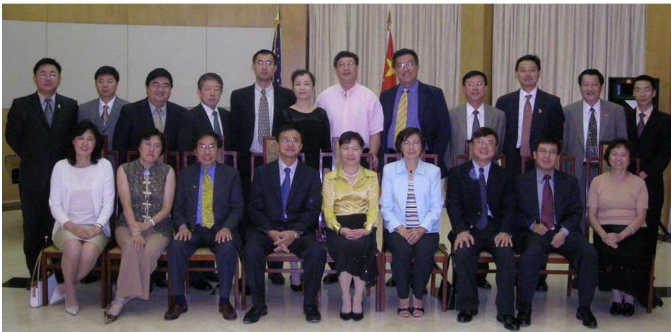
8 月 18 日中国人活动中心部分董事和执委拜访总领事馆并与乔红总领事等合影。