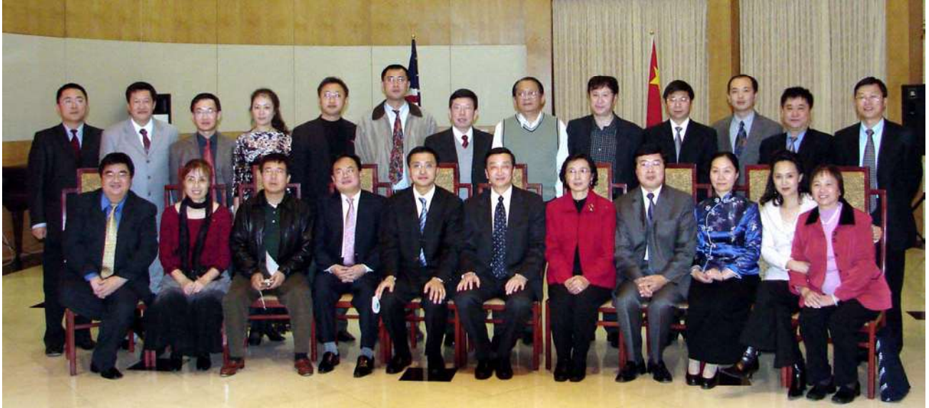
中国人活动中心第五届理事会理事和中华人民共和国驻休斯顿华锦洲总领事、房利副总领事及领事馆其他官员合影

12 月 18 日 中华人民共和国驻休斯顿总领馆新任总领事华锦洲总领事、房利副总领事及领事馆其他官员在总领馆官邸会见中国人活动中心的全体理事。