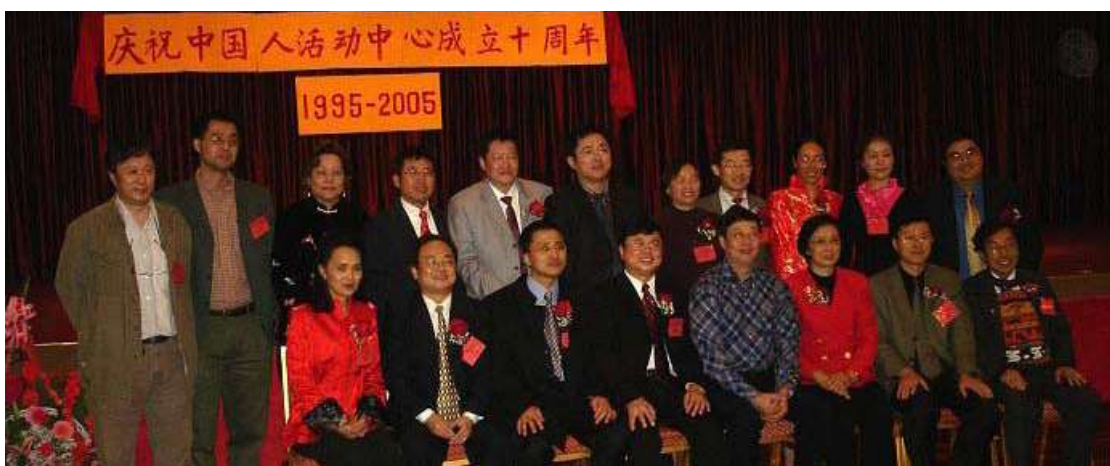
中国人活动中心理事会合影