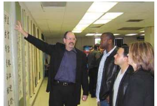
美国人向美国人介绍中国书法。