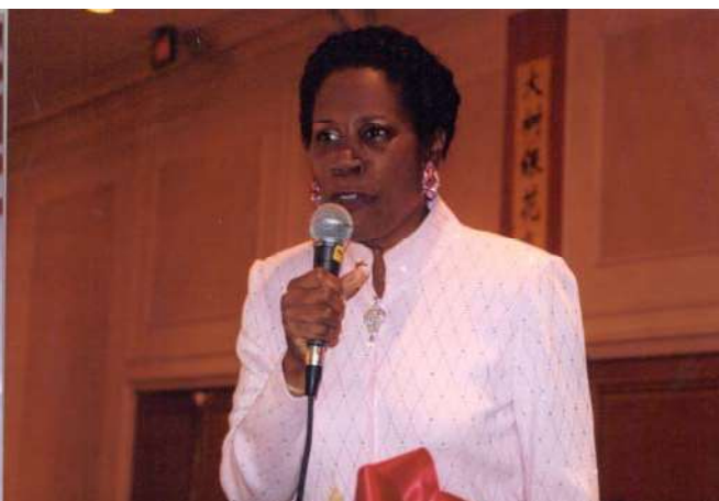
国会众议院议员女士 Shelia Jackson Lee 到场致辞