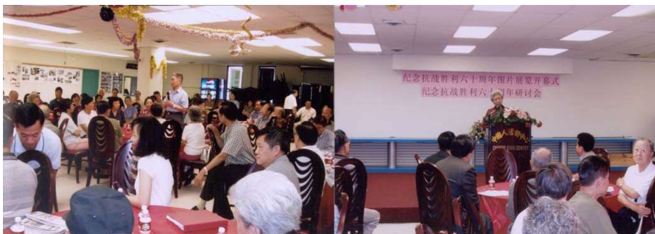
抗日老兵在会上发言