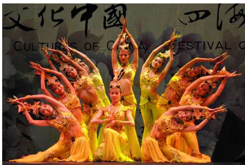
4月20日 《四川雅安大地震》捐款义演