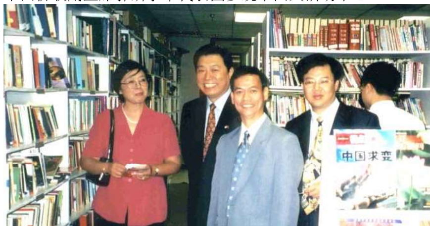
中国侨联副主席郭麟恭访问中国人活动中心图书馆