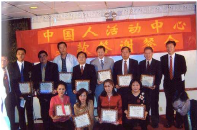
中国人活动中心给捐款人赠送感谢牌