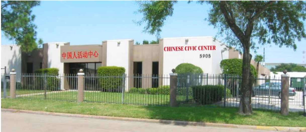
中国人活动中心新址 5905 Sovereign Drive, Houston, TX, 77036