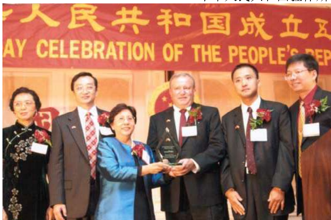
向康菲石油公司颁发了“杰出中国之友”奖