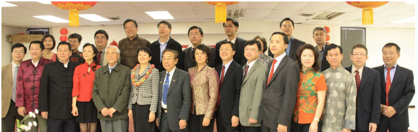
中国人活动中心历届的理事会成员和高燕平总领事（前排左六）、周鼎副总领事（前排右七）一起合影。

中国人活动中心 2 月 21 日上午 11 点在中心大厅举行一年一度的春节团拜会。侨界各社团组织的代表和负责人九十来人出席了团拜会，中国驻休斯顿总领事高燕平总领事、周鼎副总领事、侨务组长吴凯文领事参加了团拜会。大家欢聚一堂，品美食，庆新春，在一片欢声笑语中迎接中国传统新年。团拜会由徐华副执行长主持。陈珂执行长感谢大家过去一年对中心的大力支持，祝大家虎年身体健康，事业成功。高燕平总领事在团拜会上作了热情洋溢的讲话，她代表总领馆祝大家虎年身体健康，家庭团圆，事业成功，万事如意。