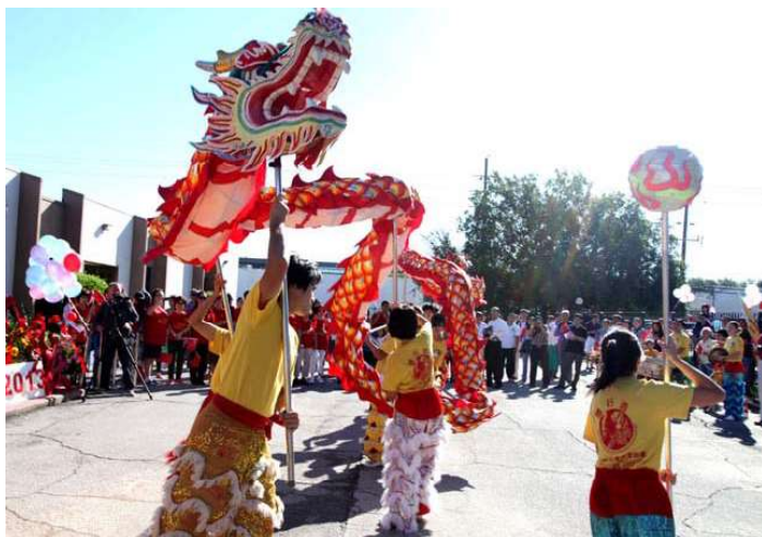
少林功夫学院精彩的舞龙表演