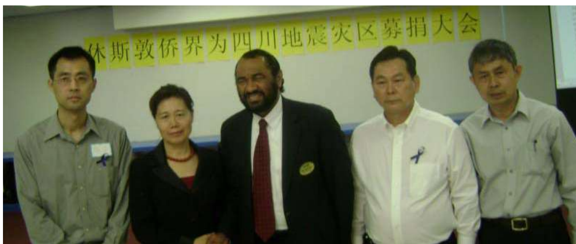
中国驻休斯顿总领事乔红和国会议员格林和募捐组织人员在一起。