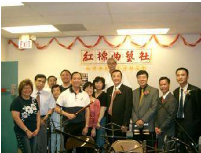
华锦洲总领事和房利副总领事参观红棉曲艺社

10月1日 刚刚出席过国庆升旗仪式的中国驻休斯顿总领事馆华锦洲总领事、房利副总领事及领事馆其他官员，访问了中国人活动中心。