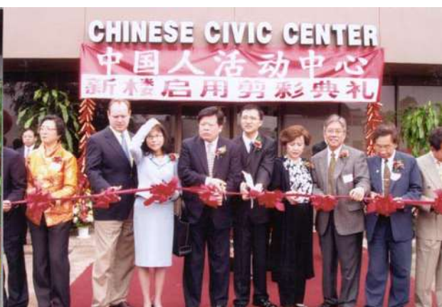
中国人活动中心举行盛大开楼仪式（一）