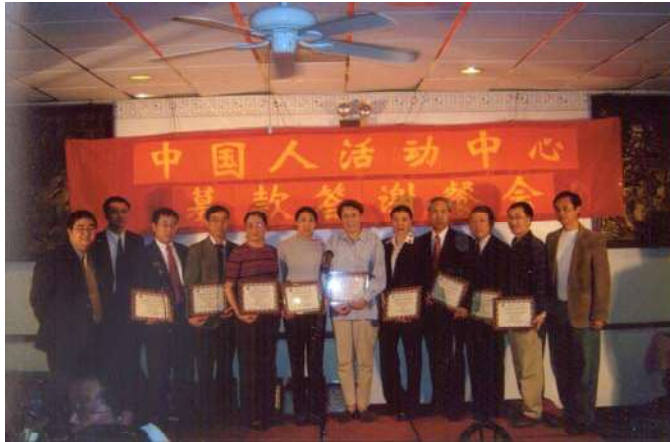
中国人活动中心给捐款人赠送感谢牌