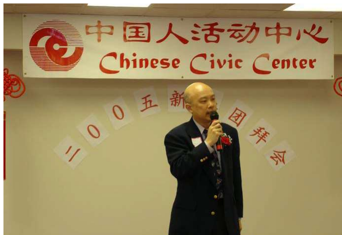
中华文化中心理事长方先生致辞