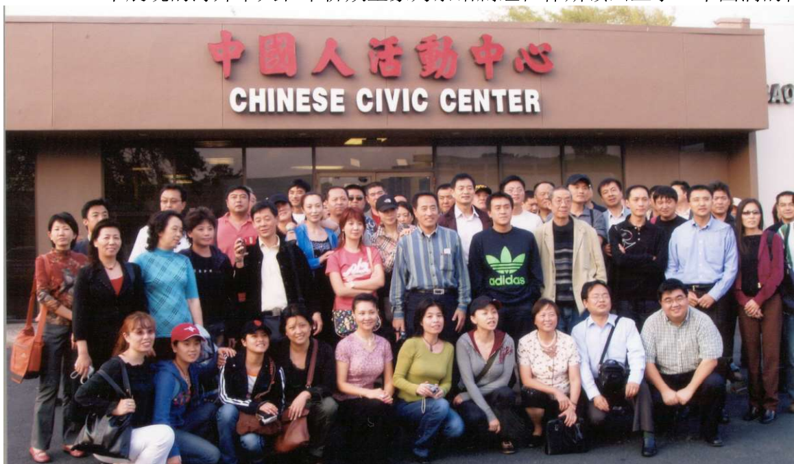
中国人民艺术剧院茶馆剧组访问中国人活动中心（11月11日）

茶馆剧组在休斯顿的两场演出空前隆重，受到休斯顿侨学各界的一致追捧。这次茶馆来休斯顿演出，阵容是历史上最大的一次，接待时间也是最久，接待任务重，开销大，牵涉各方面的人力物力空前。以休斯顿中国人活动中心全体理事为主的主办方早在几个月前就组成了有力的演出筹委会并开展了强大的宣传工作。茶馆文化周中展现的海外华人和华侨众生象为茶馆剧组在休斯顿画上了一个圆满的休止符。