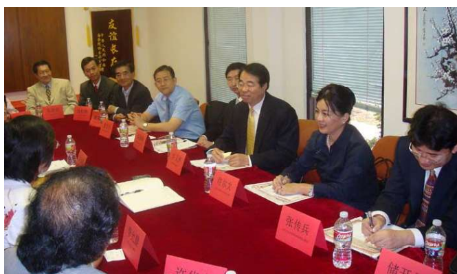
许友声副主任和中心人员座谈