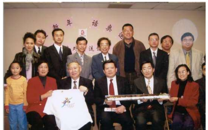
北京侨办主任乔卫、胡业顺总领事与侨社热心人士合影