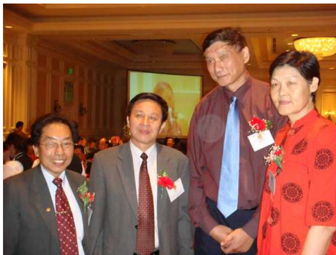
许华章董事，副总领事郁伯仁（中）和姚明的双亲（右）