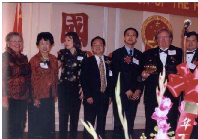
颁发“杰出中国之友”奖