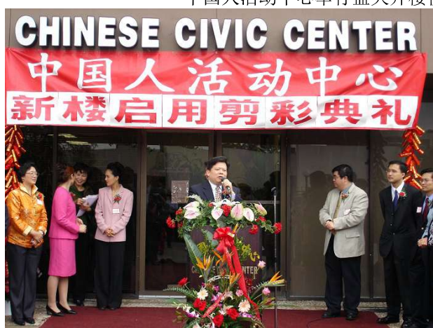
中国驻休斯顿总领事胡业顺先生致辞