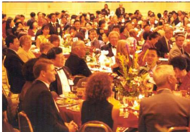
场面宏大的庆祝中华人民共和国国庆 55 周年晚宴现场