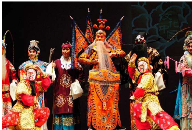
这是今次以北京京剧院为艺术班底的艺术团北美之行的首站慰侨演出。

中国人活动中心牵头承办的“文化中国·四海同春”2015新春文艺晚会于22日在美国休斯顿大学卡伦堂隆重上演。这次慰侨演出是由中国国务院侨办主办，北京市侨办承办的。中国驻休斯顿总领事李强民大使和夫人曾红燕，美国联邦众议员杰克逊-李以及当地华人华侨近千人共同观看演出。演出节目包括《真假美猴王》、《霸王别姬》、《定军山》、《空城计》、《红娘》等京剧折子戏，及《群英会》选段“自起义兵把贼来讨”、《智取威虎山》选段“早也盼晚也盼”、《龙凤呈祥》选段“昔日梁鸿配孟光”、《沙家浜》“智斗”选段等脍炙人口的经典京剧清唱节目。休斯顿当地周新来京剧艺术工作室和休斯顿国剧社也与顶级艺术家同台献艺，为观众带来京剧联唱等表演。