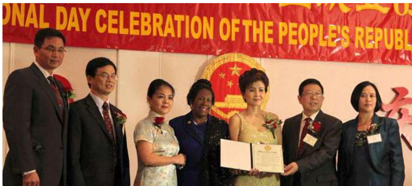
美国联邦众议员希拉·杰克逊·李（左四）携助手罗玲（右一）颁发贺状。中国驻休斯顿总领事许尔文（左三）和晚宴主席周琪（右三），共同主席姚超良（左一），董事会主席郭玉祥（右二），执行长谢克平（左二）共同接受。