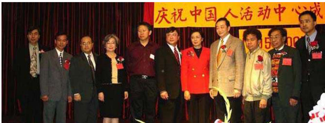
中国人活动中心名誉董事合影