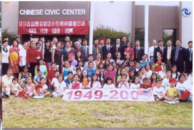
华人朋友们聚集在中国人活动中心新址门前等待五星红旗升起

10月1日 刚刚出席过国庆升旗仪式的中国驻休斯顿总领事馆华锦洲总领事、房利副总领事及领事馆其他官员，访问了中国人活动中心。