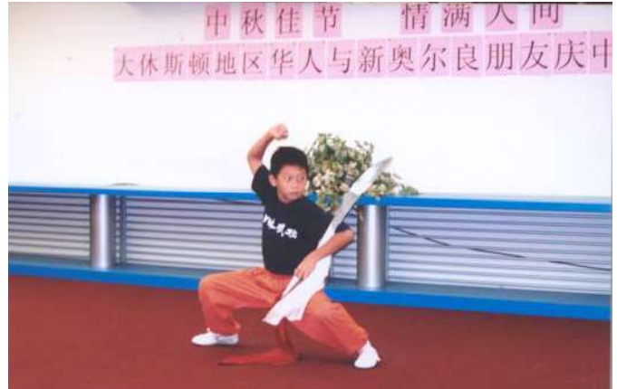
休斯顿华人朋友表演节目

9 月 12 日 晚 上 7 时 在 凤 凰 海 鲜 酒 家 举 行 休 斯 顿 侨 学 界 欢 送 中 国 驻 休 斯 顿 总 领 馆 胡 业 顺 总 领 事 夫 妇 ， 毕 刚 副 总 领 事 晚 宴 。 500 余 位 社 区 朋 友 ， 聚 会 一 堂 ， 欢 送 两 位 总 领 事 离 任 。 中 心 理 事 长 杨 俊 和 副 理 事 长 李 庆 元 主 持 。