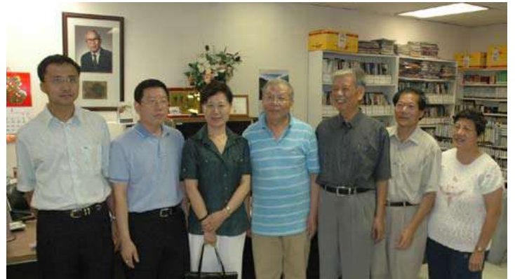
参观靳宝善图书馆