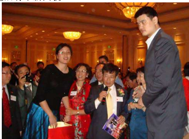
陈珂执行长，李允晨董事给姚明颁发了“中美友谊奖”