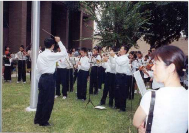
管乐队演奏中美国歌