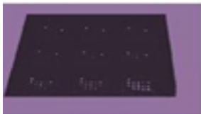
Raw data image