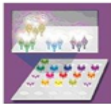
Plasma protein capture by mAB's