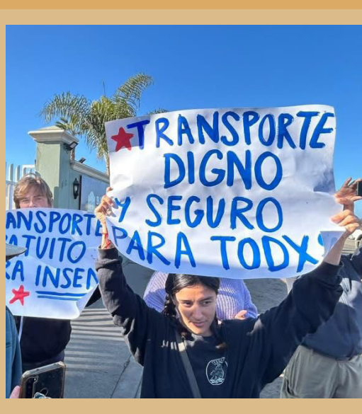
No paran las protestas por el incremento a las tarifas del transporte público. Dejó fuera de consideraciones a las personas con discapacidad.