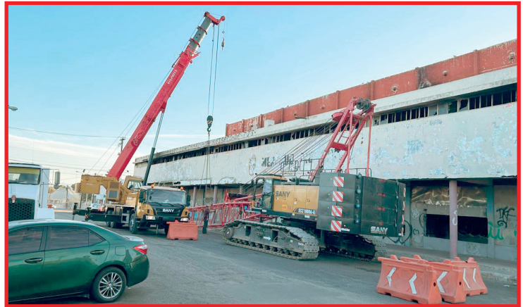
Con maquinaria especial, desde antier empezaron los trabajos de demolición del Mercado Municipal de Mexicali.

El Colegio Cachanilla lo presume como “un evento imperdible”.